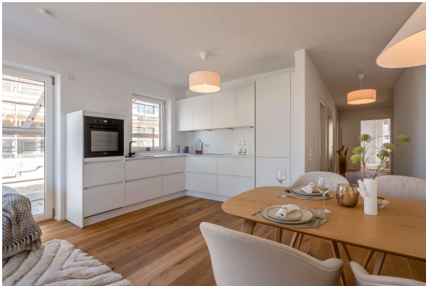
Koch - Essbereich