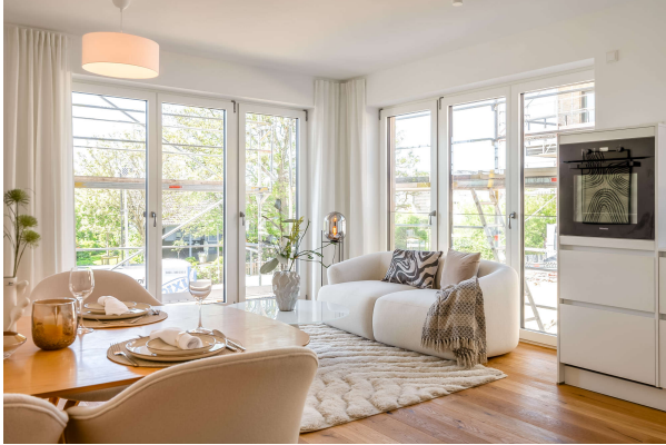
Wohn - Essbereich

Eigentumswohnung in direkter Deichnähe, Obj.5436, Whg.1