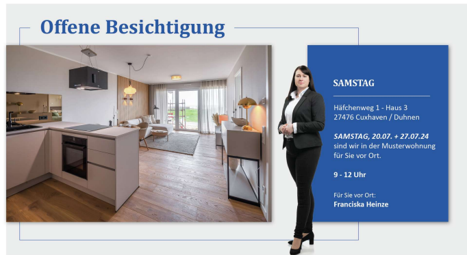
Titelbild Schautag Häfchenweg Musterwohnung 2007