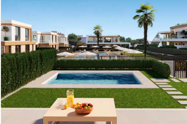
Blick in den Garten mit dem möglichen Privatpool

Cala Ratjada: Neubauobjekt mit Pool und Garten in guter Lage, Fertigstellung 2024, Obj. 6665