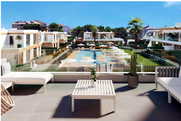
... mit Pool