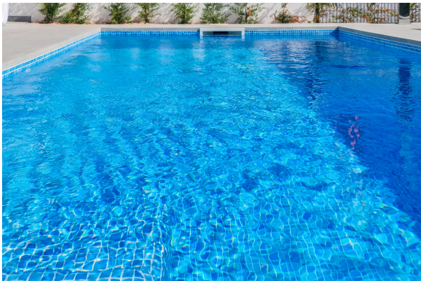
nehmen Sie eine Abkühlung und genießen Sie Ihren eigenen Pool