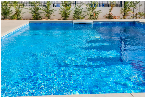
Blick auf den Pool