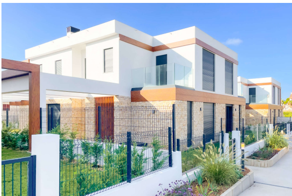
Frontansicht auf die Villa