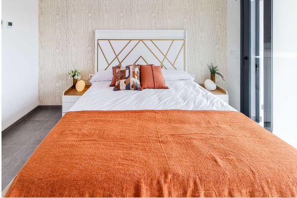
Schlafzimmer mit Doppelbett

Cala Ratjada: Neubauobjekt mit Pool und Garten in guter Lage, Fertigstellung 2024, Obj. 6665