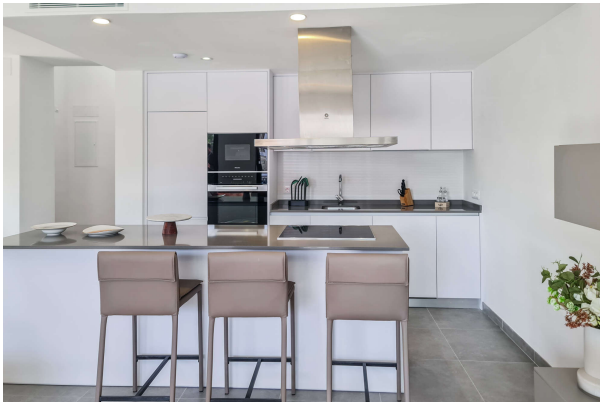
Blick auf die offene Küche ...