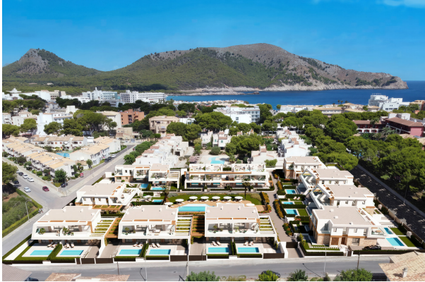
Blick über die Anlage Richtung Cala Agulla

Cala Ratjada: Neubauobjekt mit Pool und Garten in guter Lage, Fertigstellung 2024, Obj. 6665