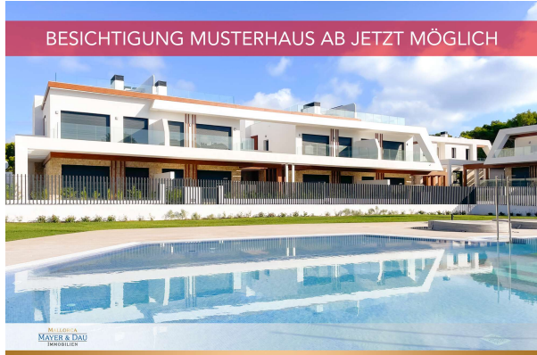
Neubau in Cala Ratjada

Cala Ratjada: Neubauobjekt mit Pool und Garten in guter Lage, Fertigstellung 2024, Obj. 6665