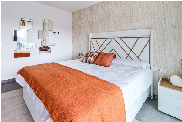
ein Schlafzimmer zum wohlfühlen