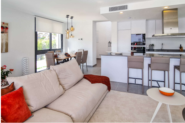
offener Wohnbereich mit Küche

Cala Ratjada: Neubauobjekt mit Pool und Garten in guter Lage, Fertigstellung 2024, Obj. 6665