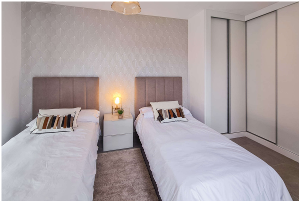
... mit zwei Einzelbetten