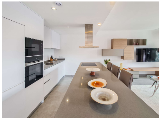
Blick in die Küche mit ihrer Kücheninsel

Cala Ratjada: Neubauobjekt mit Pool und Garten in guter Lage, Fertigstellung 2024, Obj. 6665