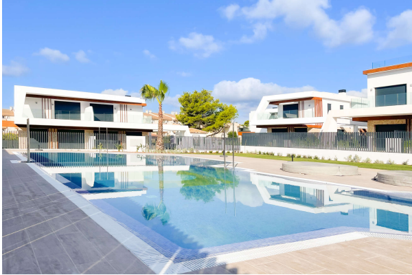
Blick auf den Poolbereich

Cala Ratjada: Neubauobjekt mit Pool und Garten in guter Lage, Fertigstellung 2024, Obj. 6665