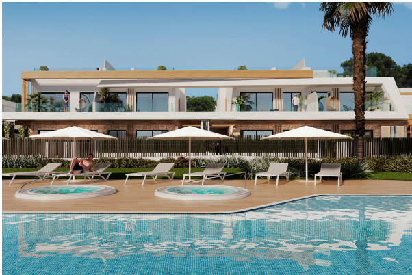
Blick auf den Gemeinschaftspool mit Jacuzzis