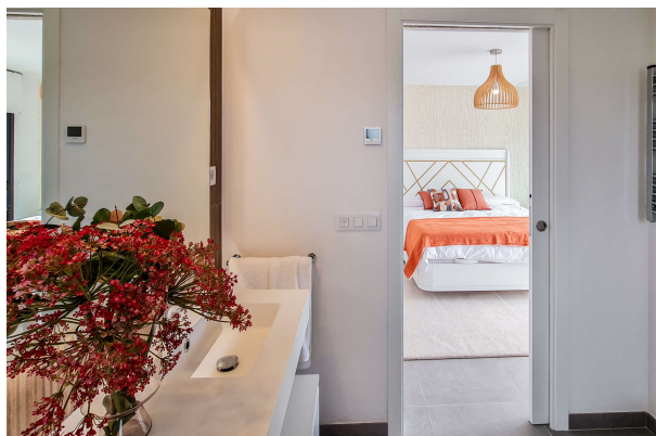
Blick vom en Suite Bad in eines der Schlafzimmer