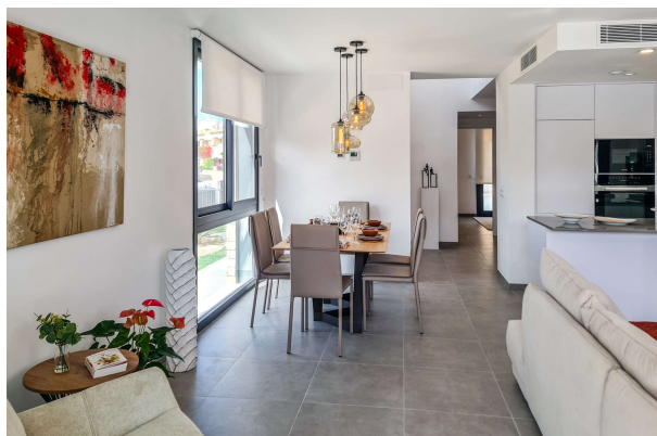
Blick in den Wohnbereich