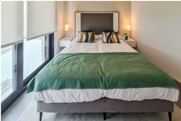
... und Bad en Suite