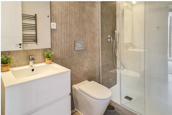
Badezimmer mit Handtuch Heizkörper