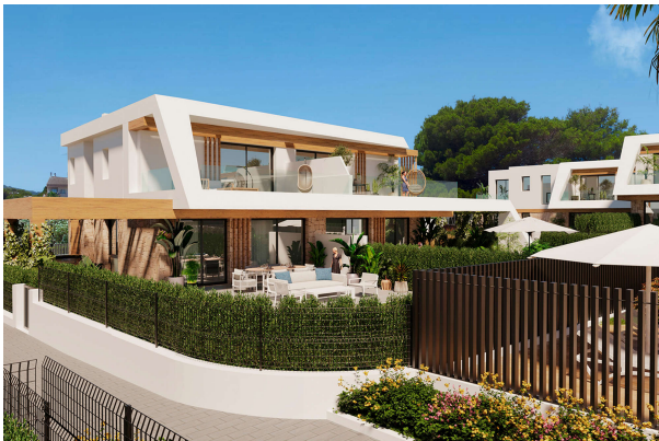
wunderschöne Neubauvilla ...