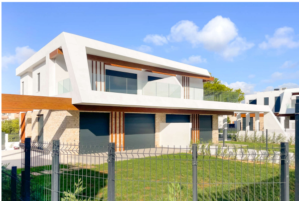
Blick auf eine der Villen