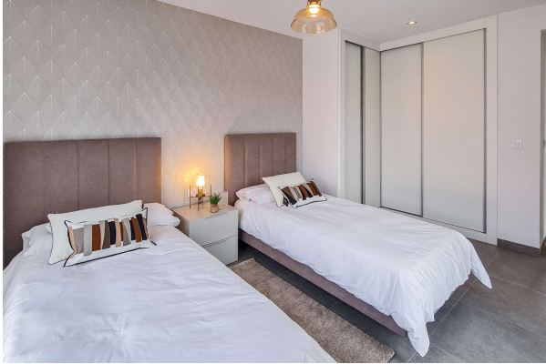
eines der drei Schlafzimmer ...

Cala Ratjada: Neubauobjekt mit Pool und Garten in guter Lage, Fertigstellung 2024, Obj. 6665