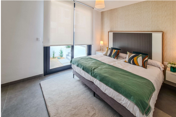
Schlafzimmer mit Doppelbett ...

Cala Ratjada: Neubauobjekt mit Pool und Garten in guter Lage, Fertigstellung 2024, Obj. 6665