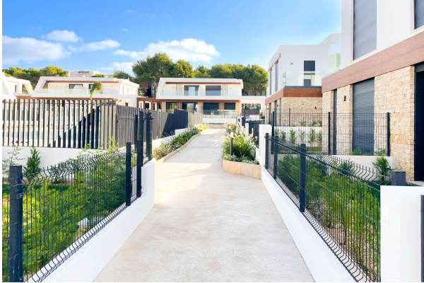
Blick vom Haupteingang aus

Cala Ratjada: Neubauobjekt mit Pool und Garten in guter Lage, Fertigstellung 2024, Obj. 6665