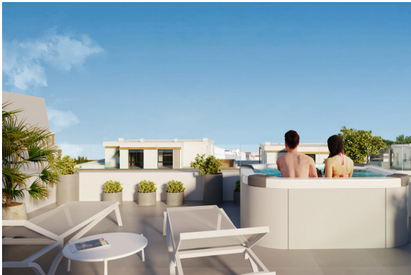
Blick von der Dachterrasse