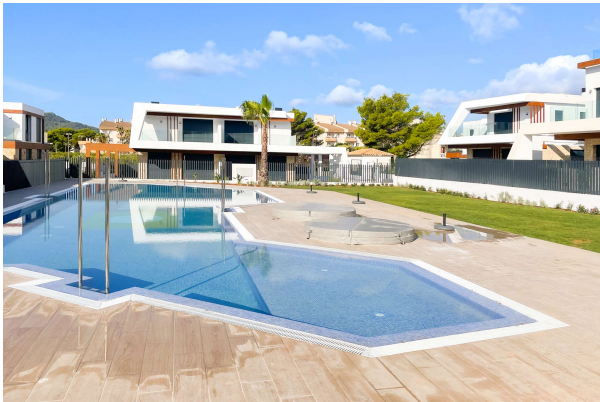
hier können Sie Ihre Bahnen ziehen