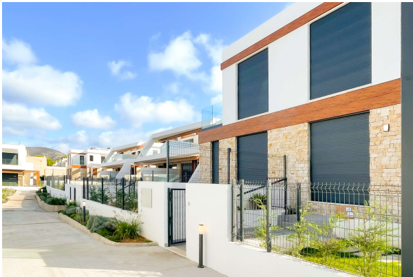
zweiter Blick vom Haupteingang