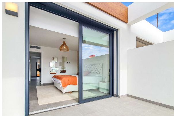
Blick von der Dachterasse in eines der Schlafzimmer