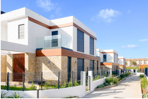
Blick vom Eingang auf die Villa

Cala Ratjada: Neubauobjekt mit Pool und Garten in guter Lage, Fertigstellung 2024, Obj. 6665