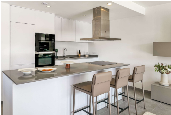
... wo kochen Spaß macht!