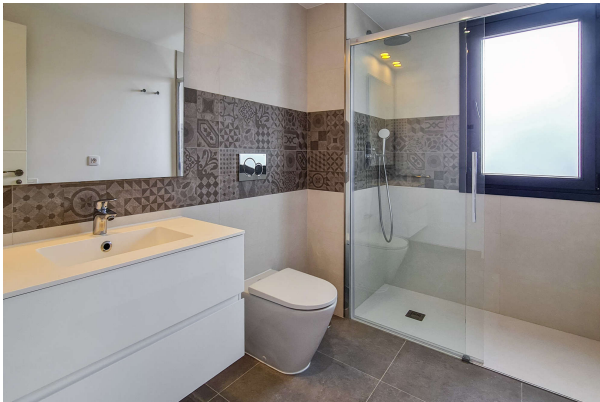
eines der drei Badezimmer