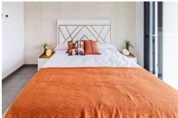
Schlafzimmer mit Doppelbett

Cala Ratjada: Sind Sie bereit für einen Neuanfang ? Fertigstellung 2024, Obj. 6696