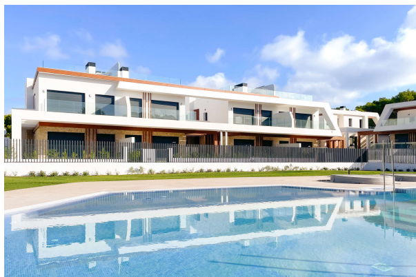
Blick vom Pool auf die Doppelhäuser