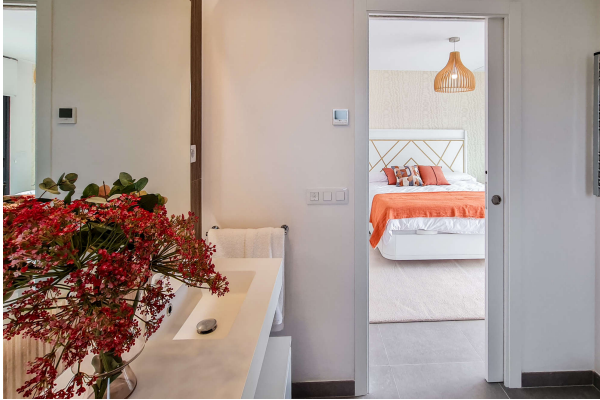
Blick vom en Suite Bad in eines der Schlafzimmer

Cala Ratjada: Sind Sie bereit für einen Neuanfang ? Fertigstellung 2024, Obj. 6696