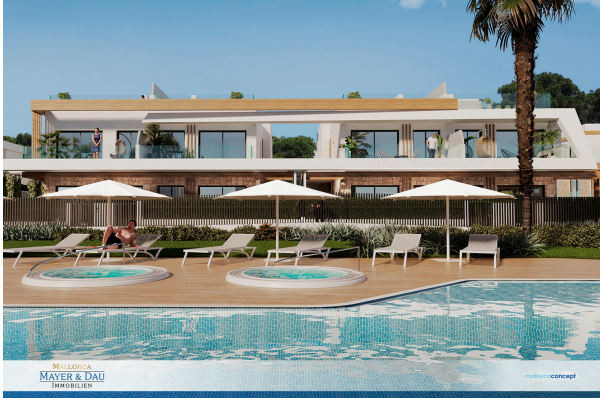
Blick vom Gemeinschaftspool-M&D Mallorca Titel

Cala Ratjada: Sind Sie bereit für einen Neuanfang ? Fertigstellung 2024, Obj. 6696