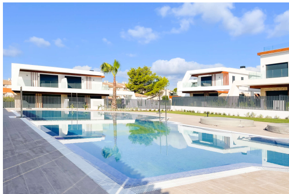
Blick auf den Pool