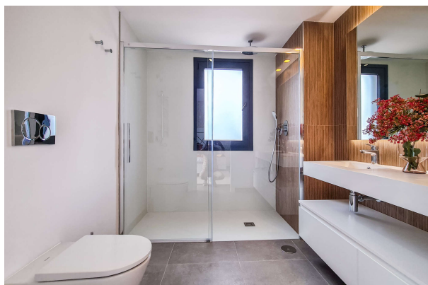
eines der drei en Suite Bäder