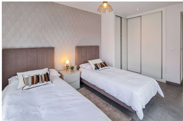
... mit zwei Einzelbetten

Cala Ratjada: Sind Sie bereit für einen Neuanfang ? Fertigstellung 2024, Obj. 6696