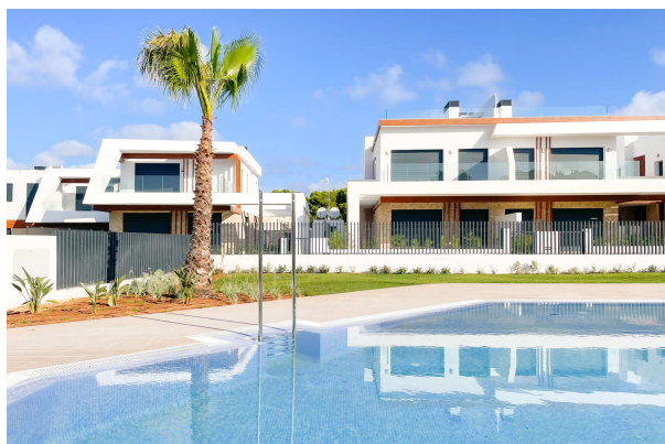
Poolbereich mit schöner Grünanlage