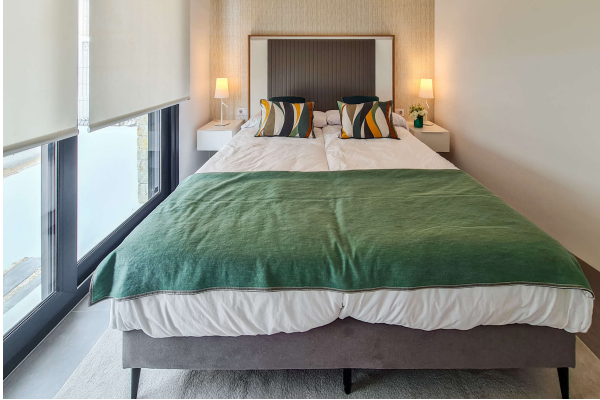
... und Bad en Suite

Cala Ratjada: Sind Sie bereit für einen Neuanfang ? Fertigstellung 2024, Obj. 6696