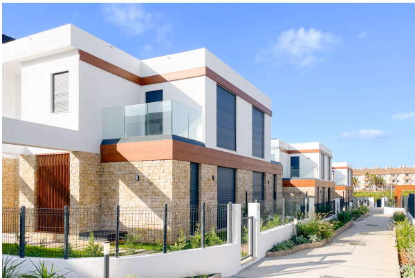
Nebeneingang zu den Villen