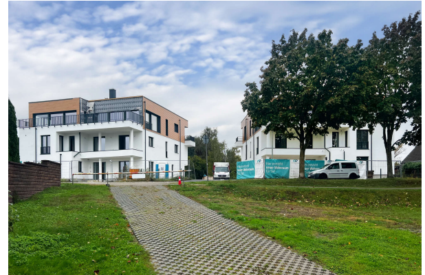
Baufortschritt Oktober 2024