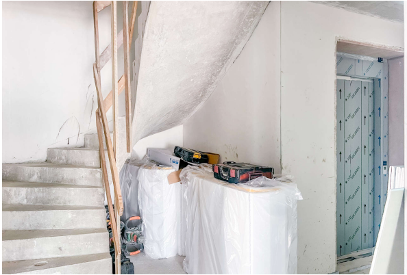
Treppenhaus und Aufzug Baufortschritt 06/ 2024

Attraktive Neubauwohnung nach KfW 55 EE mit hohem Komfort & Terrassen- direkt am Werlsee! Obj. 6892