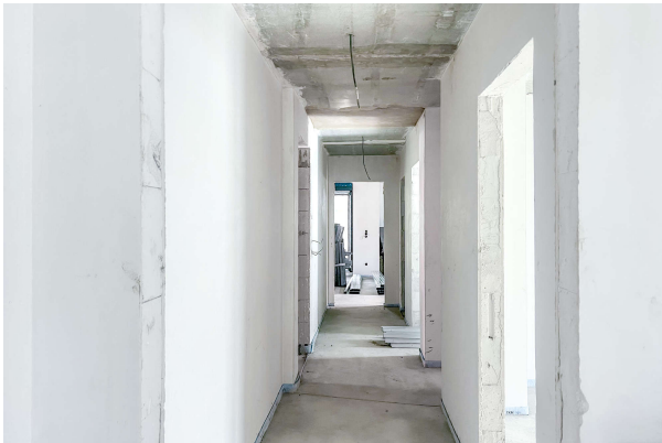
Baufortschritt WE 1 06/ 2024