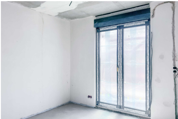
Baufortschritt WE 1 06/ 2024