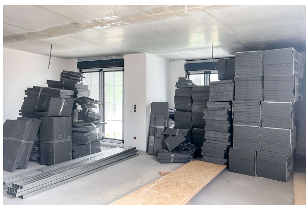
Baufortschritt WE 1 06/ 2024