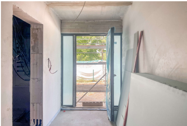
Hauseingangsbereich Baufortschritt 06/ 2024