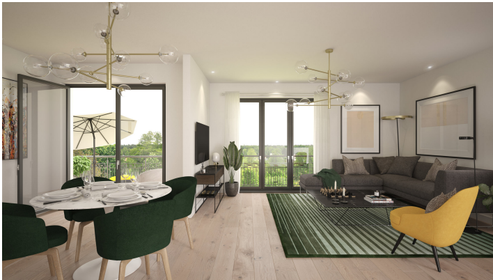
Visualisierung WE1 Wohnbereich