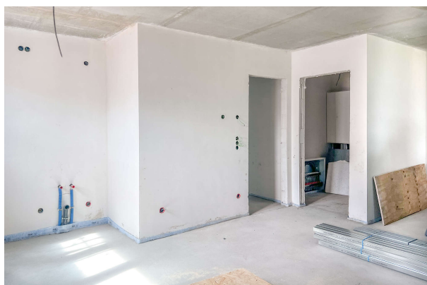
Baufortschritt WE 1 06/ 2024