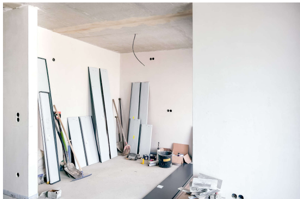
WE 2 Baufortschritt 06/ 2024

Attraktive Neubauwohnung nach KfW 55 EE mit hohem Komfort & Terrassen- direkt am Werlsee! Obj. 6893