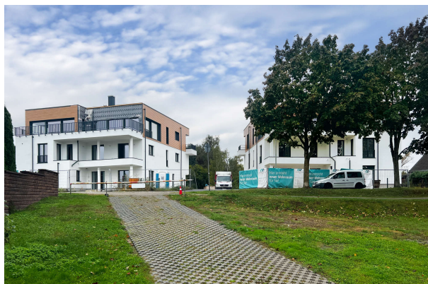
Baufortschritt Oktober 2024