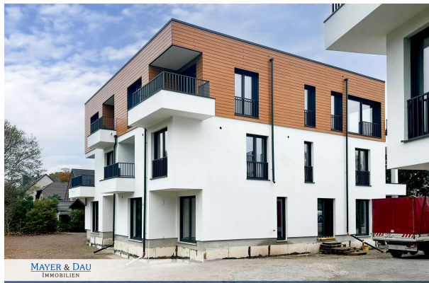
Baufortschritt Oktober 2024

Attraktive Neubauwohnung nach KfW 55 EE mit hohem Komfort & Terrassen- direkt am Werlsee! Obj. 6893