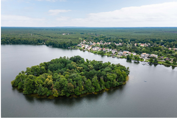
Luftbild 09/ 2023

Attraktive Neubauwohnung nach KfW 55 EE mit hohem Komfort & Terrassen- direkt am Werlsee! Obj. 6893