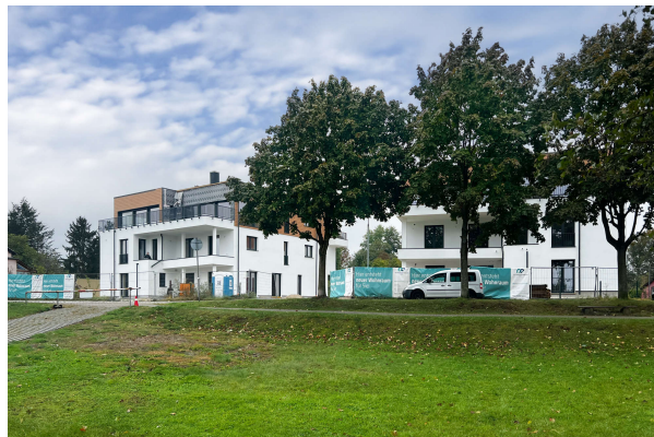
Baufortschritt Oktober 2024