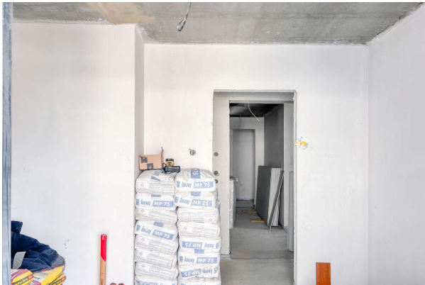
WE 2 Baufortschritt 06/ 2024