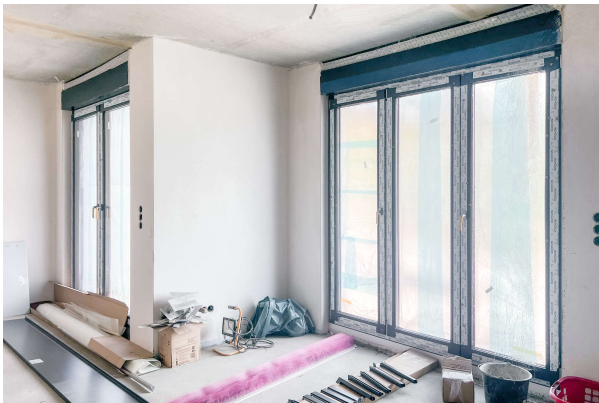
WE 2 Baufortschritt 06/ 2024