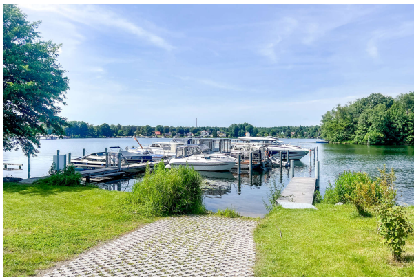
Baufortschritt 06/ 2024