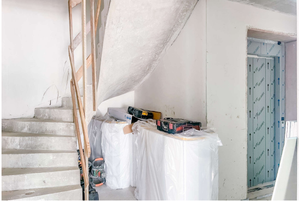
Treppenhaus Baufortschritt 06/ 2024

Attraktive Neubauwohnung nach KfW 55 EE mit hohem Komfort & Balkonen- direkt am Werlsee! Obj. 6894