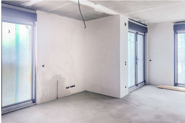
WE 3 Baufortschritt 06/ 2024

Attraktive Neubauwohnung nach KfW 55 EE mit hohem Komfort & Balkonen- direkt am Werlsee! Obj. 6894