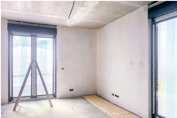
WE 3 Baufortschritt 06/ 2024