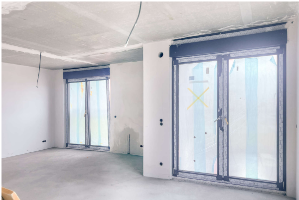
WE 3 Baufortschritt 06/ 2024