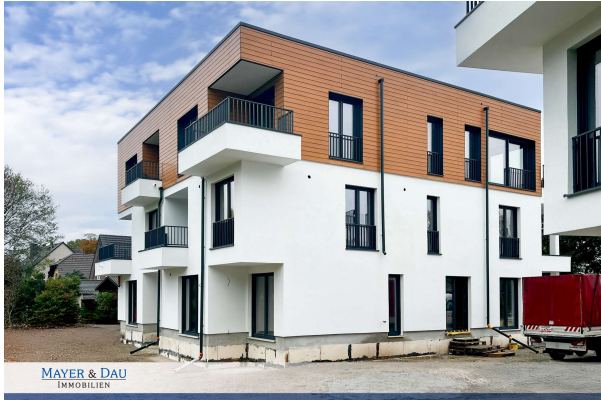
Baufortschritt Oktober 2024

Attraktive Neubauwohnung nach KfW 55 EE mit hohem Komfort & Balkonen- direkt am Werlsee! Obj. 6894