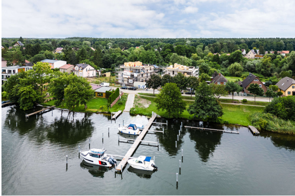
Luftbild 09/ 2023

Attraktive Neubauwohnung nach KfW 55 EE mit hohem Komfort & Balkonen- direkt am Werlsee! Obj. 6894