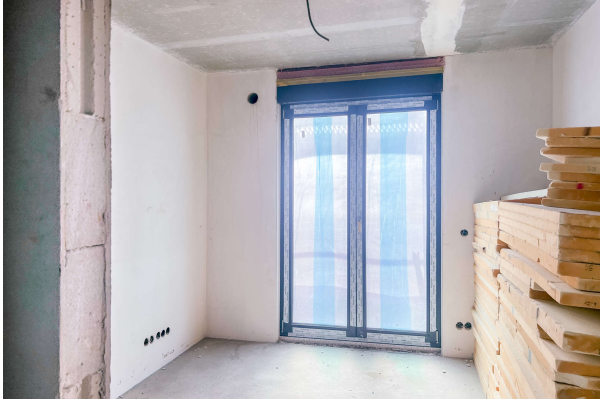
WE 3 Baufortschritt 06/ 2024

Attraktive Neubauwohnung nach KfW 55 EE mit hohem Komfort & Balkonen- direkt am Werlsee! Obj. 6894