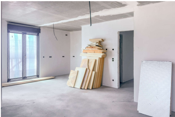
WE 3 Baufortschritt 06/ 2024