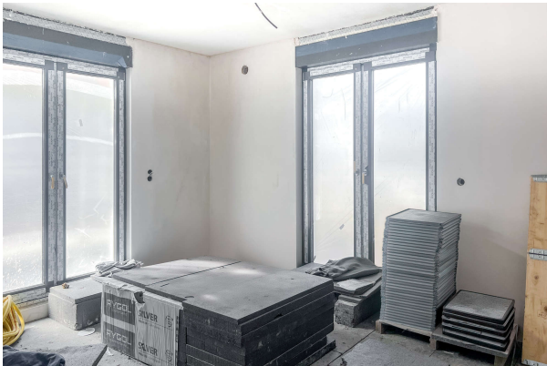
Baufortschritt WE 8 06/ 2024