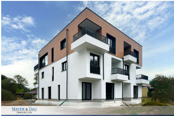
Baufortschritt Oktober 2024