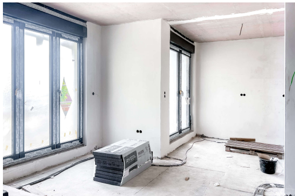
Baufortschritt WE 8 06/ 2024

Attraktive Neubauwohnung nach KfW 55 EE mit hohem Komfort & Terrassen- direkt am Werlsee! Obj. 6897