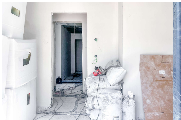
Baufortschritt WE 8 06/ 2024