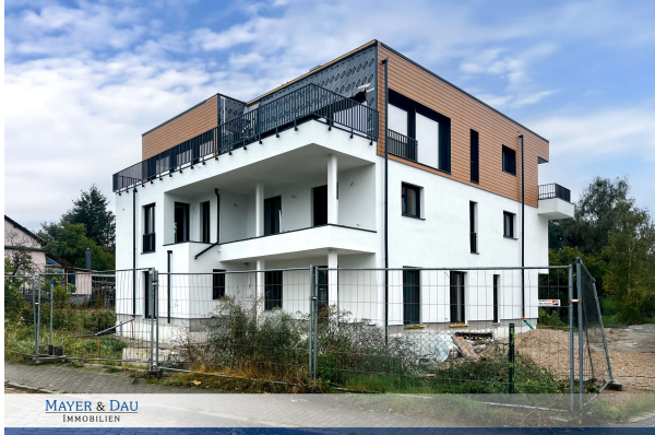
Baufortschritt Oktober 2024

Attraktive Neubauwohnung nach KfW 55 EE mit hohem Komfort & Terrassen- direkt am Werlsee! Obj. 6897