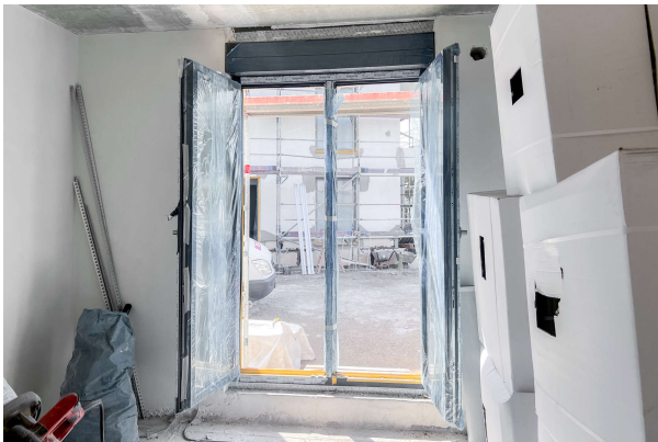
Baufortschritt WE 8 06/ 2024