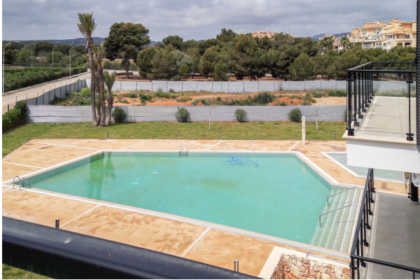
Blick auf die Poollandschaft