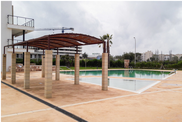
Blick auf die Poollandschaft