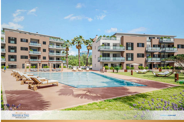
Neubau Bauabschnitt 3