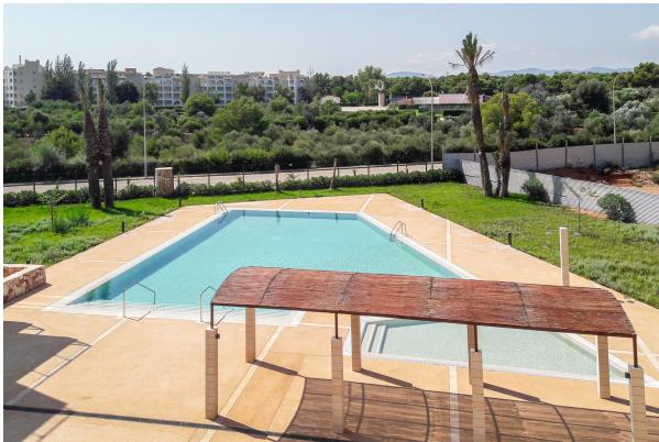
Blick auf die Poollandschaft