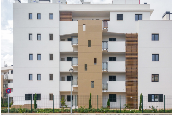
Außenfassade Sicht vom Parkplatz aus