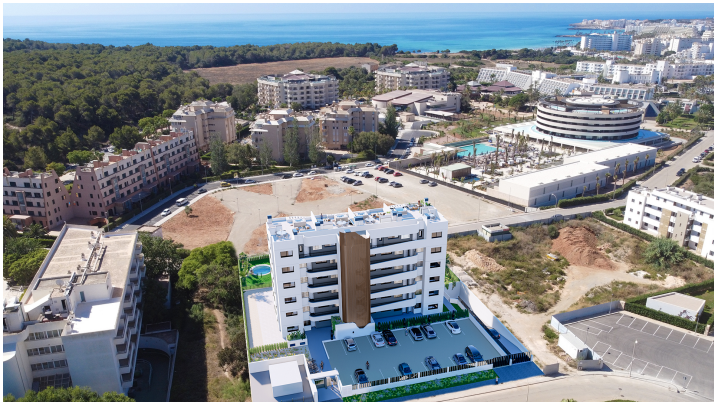
La Perla Sa Coma Luftbild