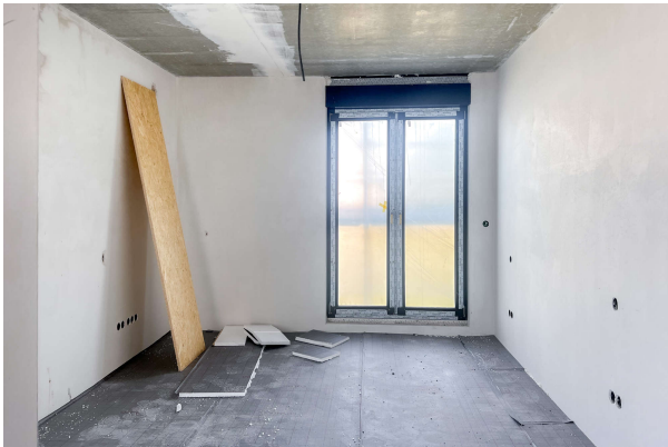
Baufortschritt WE 9 06/ 2024