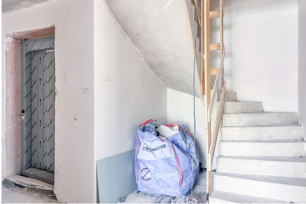
Baufortschritt 06/ 2024 Treppenhaus und Aufzug

Attraktive Neubauwohnung nach KfW 55 EE mit hohem Komfort & Terrassen- direkt am Werlsee! Obj. 6923