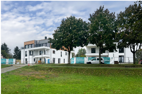
Baufortschritt Oktober 2024