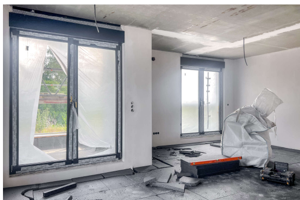
Baufortschritt WE 9 06/ 2024