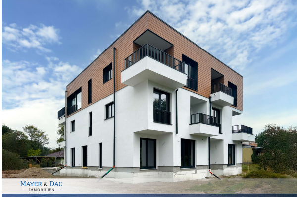
Baufortschritt Oktober 2024

Attraktive Neubauwohnung nach KfW 55 EE mit hohem Komfort & Terrassen- direkt am Werlsee! Obj. 6923