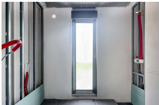
Baufortschritt WE 9 06/ 2024

Attraktive Neubauwohnung nach KfW 55 EE mit hohem Komfort & Terrassen- direkt am Werlsee! Obj. 6923