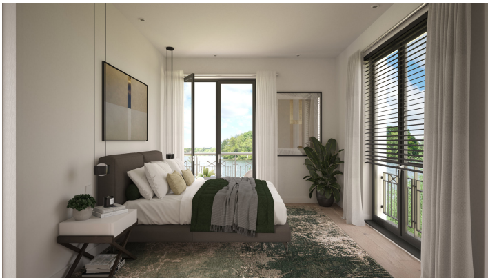
Visualisierung WE 9 Schlafzimmer