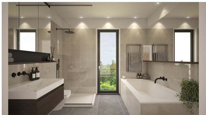
Visualisierung WE 9 Bad