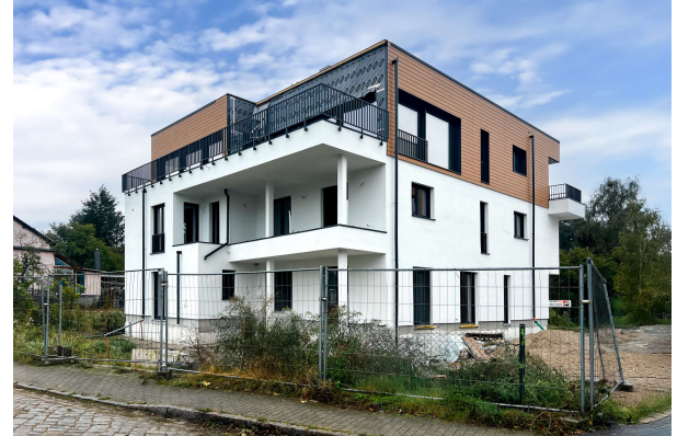
Baufortschritt Oktober 2024