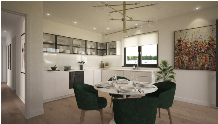
Visualisierung WE 9 Küche