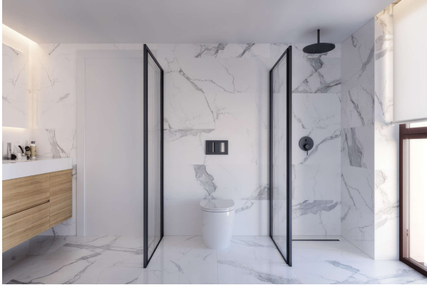
Bad Design Shine