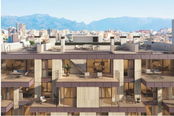
Weitblick von der Dachterrasse