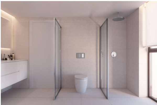
Bad Design Light