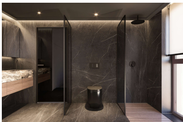
Bad Design Glam