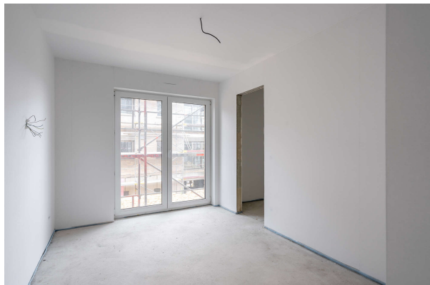
Schlafzimmer 1 mit Ankleide

Ferienwohnung direkt am Meer, Obj.7198 - Haus 2 WE 6