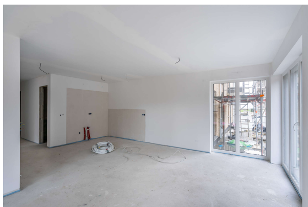
Koch / Essbereich