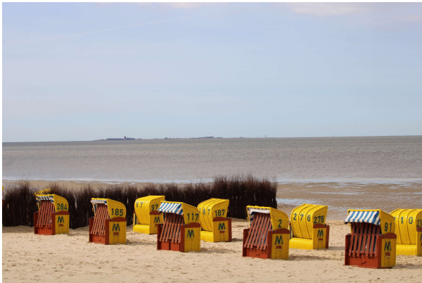
Blick nach Neuwerk