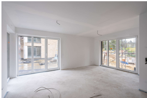
Wohn / Essbereich