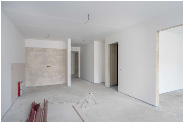
Koch / Essbereich