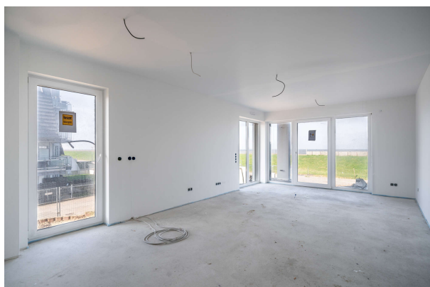
Wohn - Essbereich