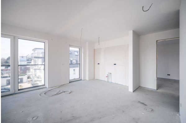
Koch - Essbereich

Ferienwohnung mit seitlichem Meerblick in Top-Lage, Obj.7220, Haus 3 - WE 11