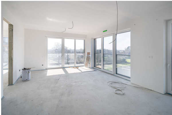
Wohn - Essbereich