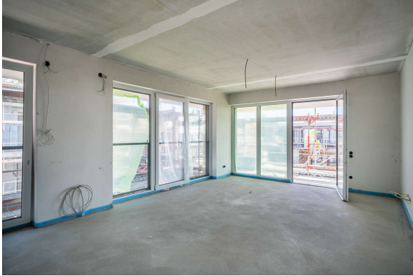
Wohnen - Kochen

Dauerwohnung direkt am Deich mit seitlichem Meerblick, Obj.7225, Haus 3 - WE 16