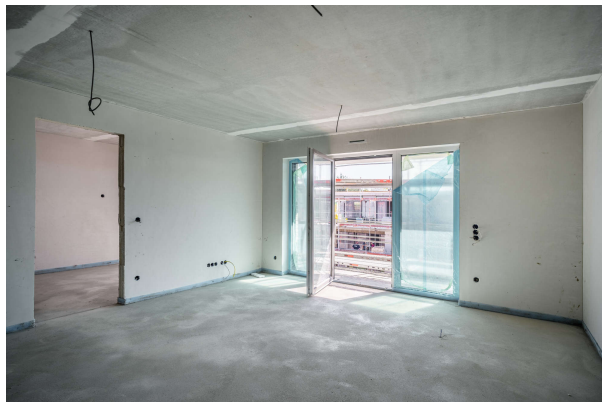
Wohnen - Kochen