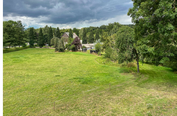
Blick auf die Weiden