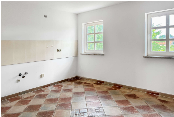
Blick in die Küche