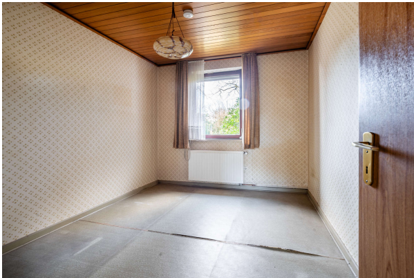
Essen / Arbeiten