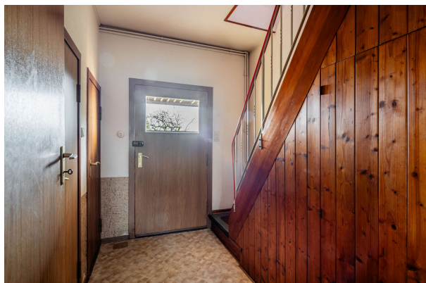
Flur mit Hintereingang