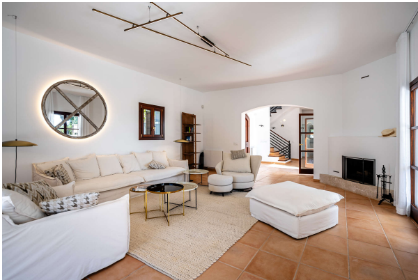
...mit gemütlichem Kamin