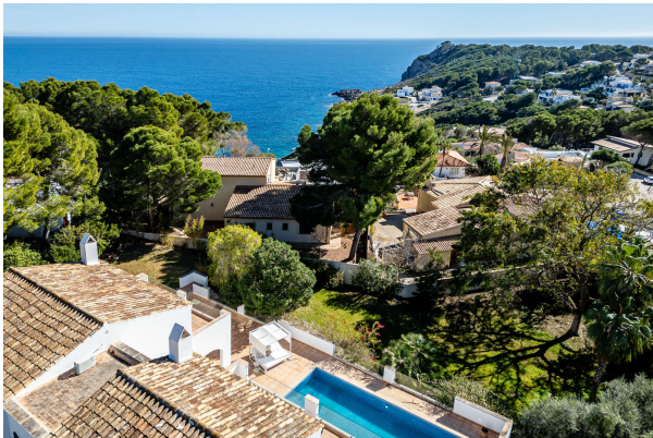
Spüren Sie die Meeresbrise?