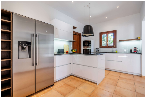
Küche mit Markengeräten