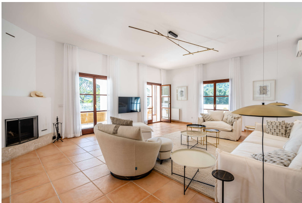
...und Ausgang zur Poolterrasse