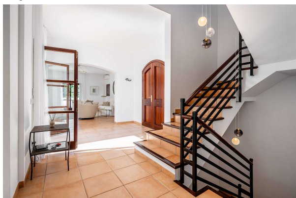
...mit stilvollem Treppenhaus