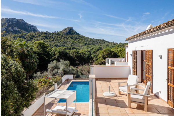
Balkone mit Panoramablick

Hier kommen Sie aus einem guten Haus! Obj. 7542