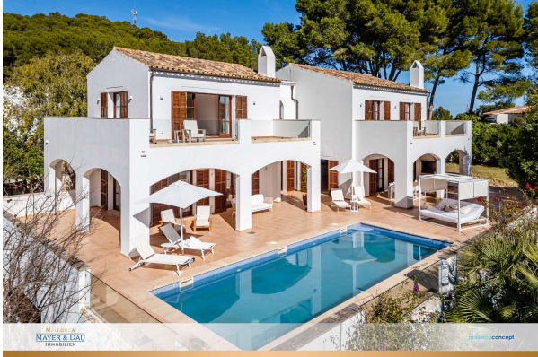
Mediterrane Villa in Cala Provensals

Hier kommen Sie aus einem guten Haus! Obj. 7542