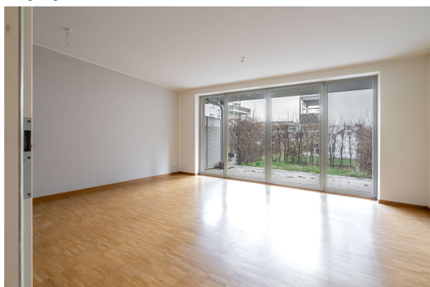
Wohn- und Esszimmer