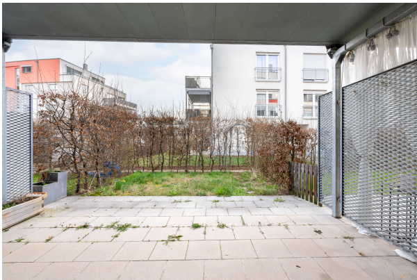
Terrasse nebst Garten