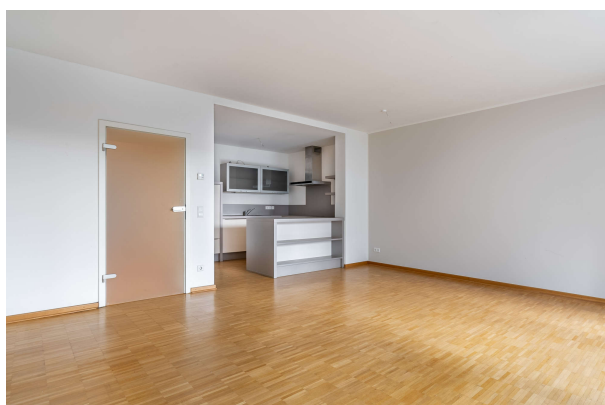
Wohn- und Esszimmer