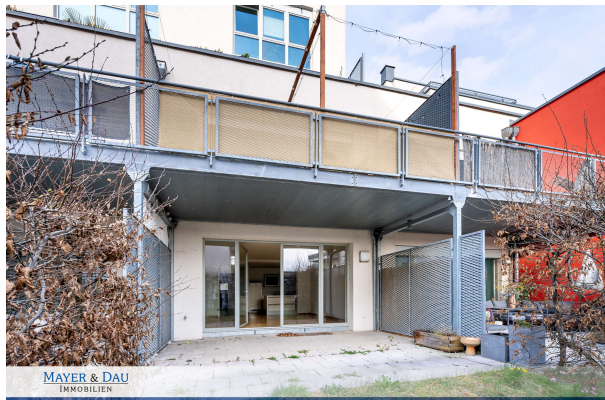
Terrasse nebst Garten

Fürth: Hochwertige Erdgeschosswohnung mit Garten im wunderschönen Fürth-Unterfarnbach, Obj. 7593