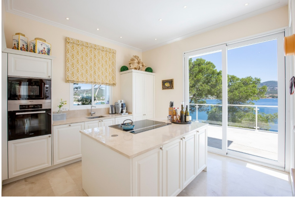
hochwertig ausgestattete Küche mit Kochinsel

TOP Villa in erster Meereslinie. „Meer“ geht nicht! Obj. 7596