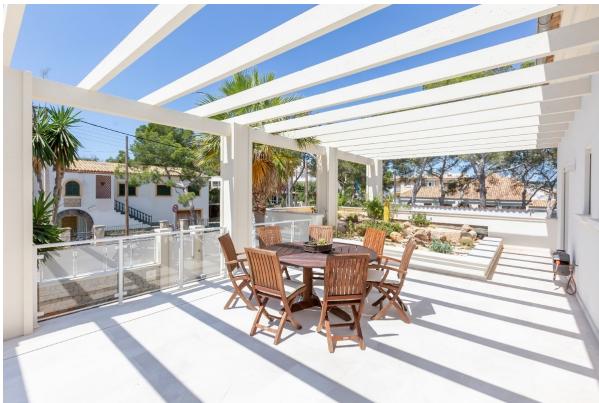
Terrasse im oberen Stockwerk