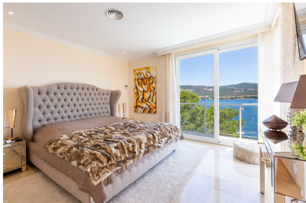
süße Träume mit Wellenrauschen garantiert

TOP Villa in erster Meereslinie. „Meer“ geht nicht! Obj. 7596