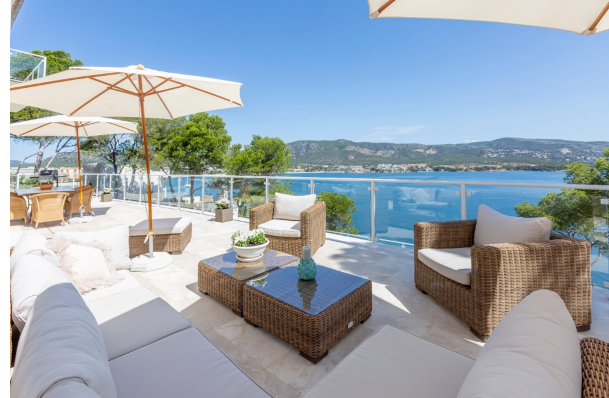
Leben direkt am Meer!