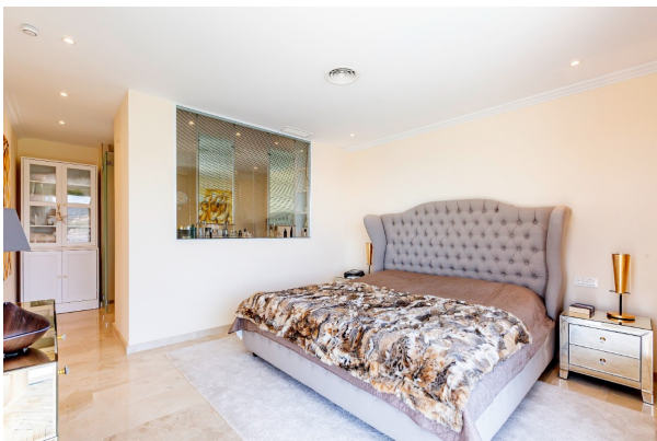
Schlafzimmer mit Bad en Suite