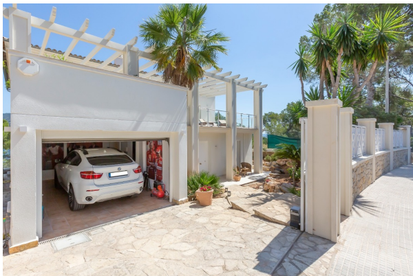
Garage und Abstellraum