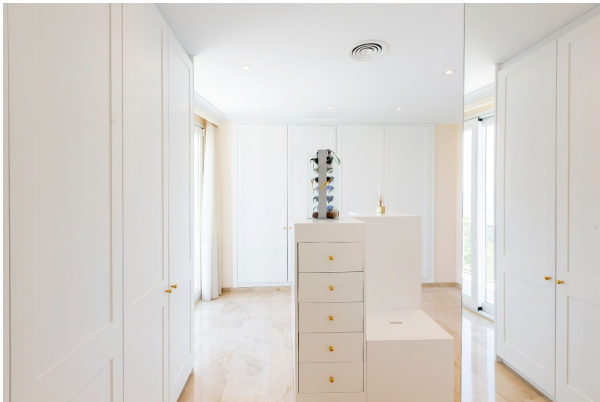
Ankleidezimmer mit viel Platz