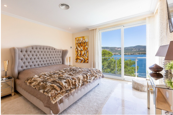
süße Träume mit Wellenrauschen garantiert

TOP Villa in erster Meereslinie. „Meer“ geht nicht! Obj. 7596