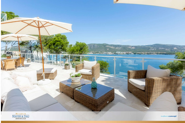
Leben direkt am Meer!!

TOP Villa in erster Meereslinie. „Meer“ geht nicht! Obj. 7596