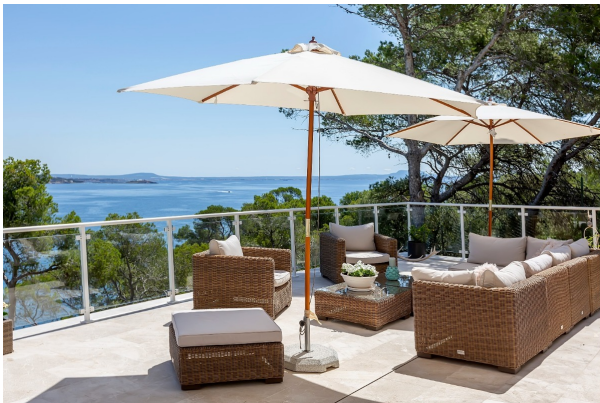
...mit gaaanz viel Platz