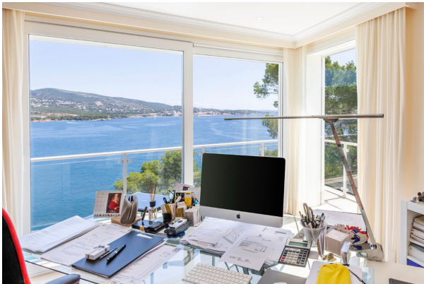
Wer möchte nicht so arbeiten?