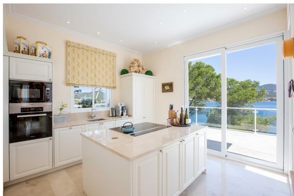
hochwertig ausgestattete Küche mit Kochinsel

TOP Villa in erster Meereslinie. „Meer“ geht nicht! Obj. 7596