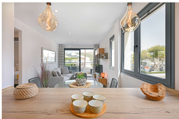
mit offener Raumgestaltung