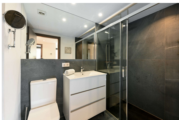
modernes Bad mit Dusche