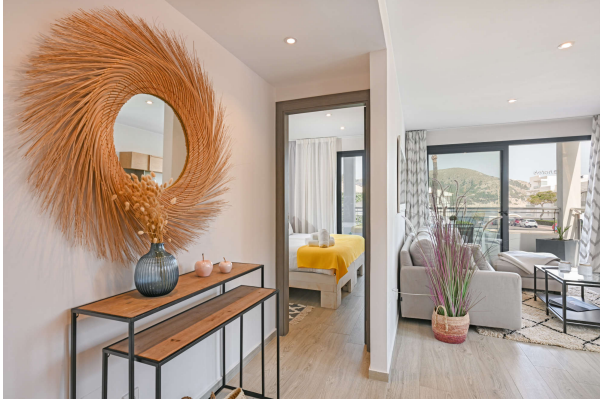
mit geschmackvoller Dekoration

Hereinspaziert in Ihren Ferientraum!!! Obj.7675