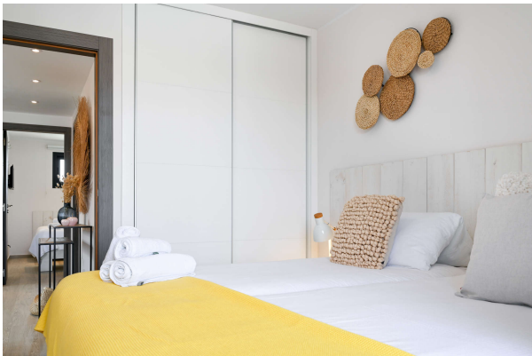
... mit Einbauschränk