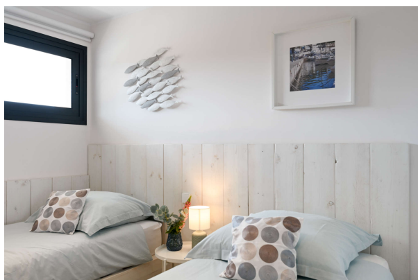
...und hübschen Details