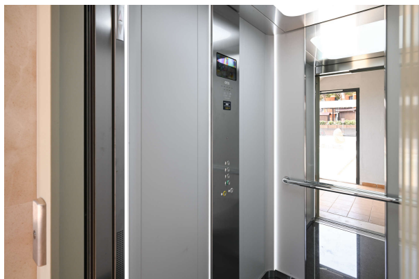
Fahrstuhl zu den Etagen