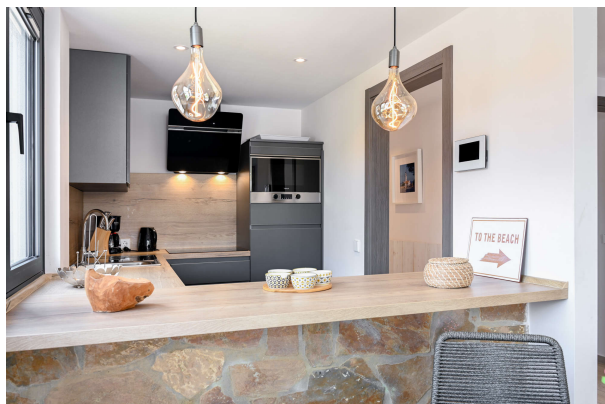
tolle Optik am Tresen

Hereinspaziert in Ihren Ferientraum!!! Obj.7675