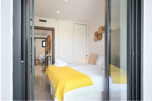
...und Ausgang auf die Terrasse

Hereinspaziert in Ihren Ferientraum!!! Obj.7675