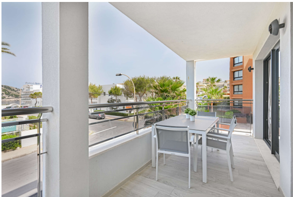
..mit ausreichend Platz