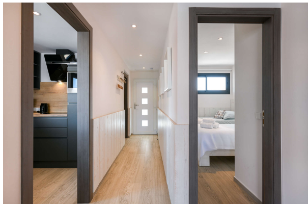
heller Flur und Eingangsbereich

Hereinspaziert in Ihren Ferientraum!!! Obj.7675