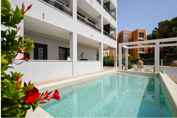
zu den Wohnungseingängen

Hereinspaziert in Ihren Ferientraum!!! Obj.7675