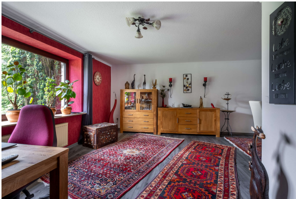
Blick in Wohnzimmer