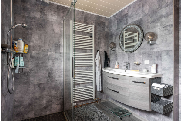
andere Ansicht Badezimmer

Einfamilienhaus mit zwei zusätzlichen Appartements und Außenpool in Oldenburg, Objekt-Nr.: 7701