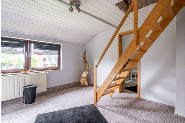
Zugang zum Spitzboden

Einfamilienhaus mit zwei zusätzlichen Appartements und Außenpool in Oldenburg, Objekt-Nr.: 7701