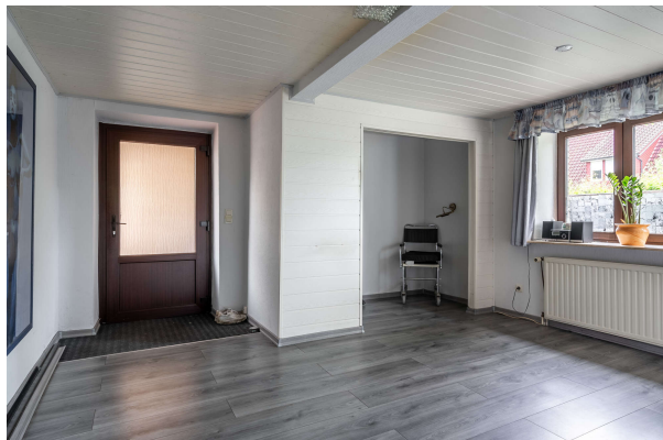
Blick ins App.

Einfamilienhaus mit zwei zusätzlichen Appartements und Außenpool in Oldenburg, Objekt-Nr.: 7701