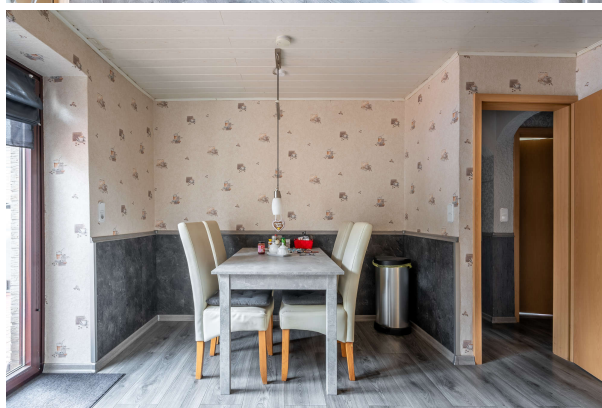
Essbereich in der Küche