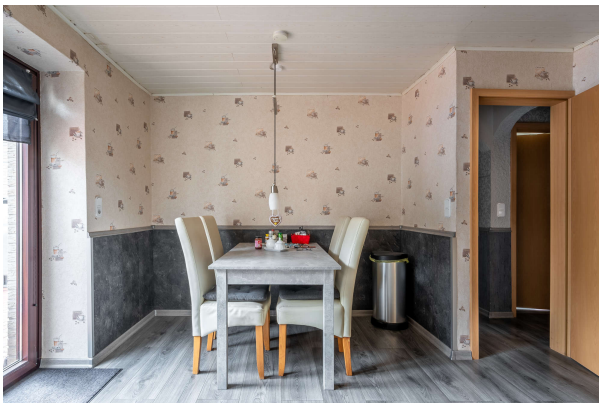
Essbereich in der Küche