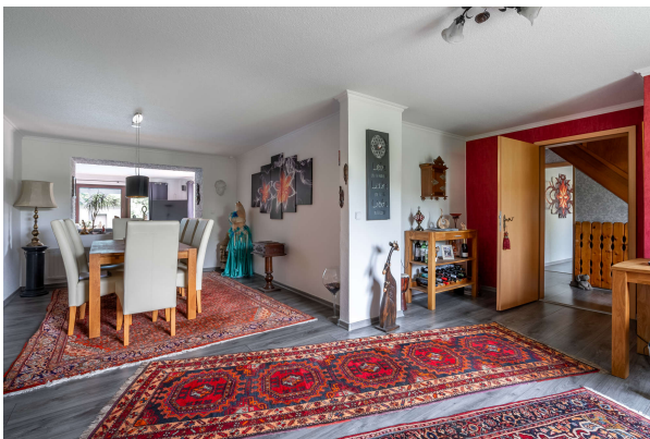
Wohn und Esszimmer