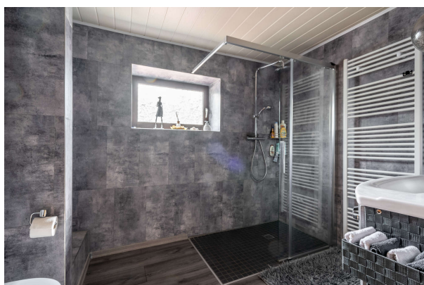
Badezimmer im EG