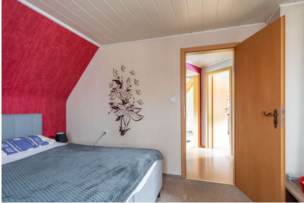
Schlafzimmer 2 DG

Einfamilienhaus mit zwei zusätzlichen Appartements und Außenpool in Oldenburg, Objekt-Nr.: 7701