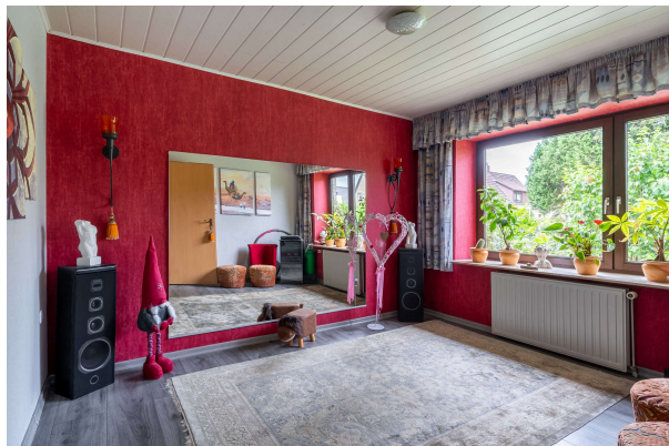
Wohnraum 2 EG

Einfamilienhaus mit zwei zusätzlichen Appartements und Außenpool in Oldenburg, Objekt-Nr.: 7701