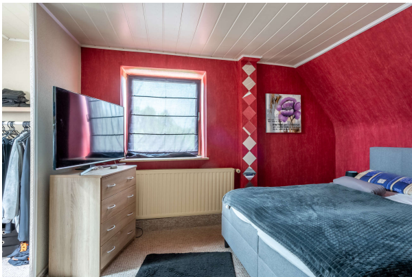
Schlafzimmer 2 DG