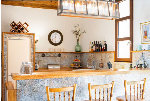
...mit kommunikativem Tresen

Außergewöhnlich! Besonderes Schmuckstück mit Pool und mediterraner Oase. Obj. 7715