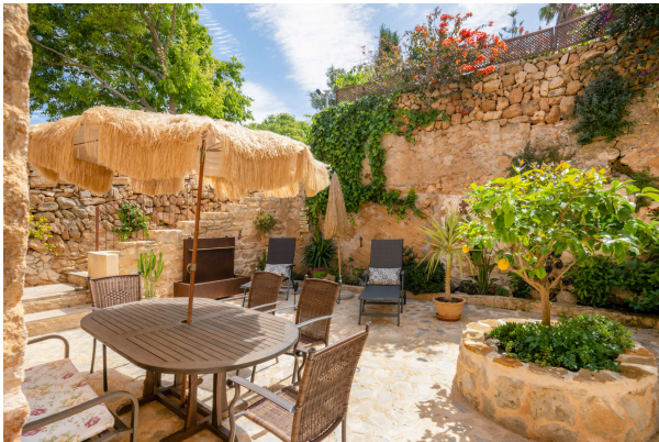
Gartentraum Ansicht 3