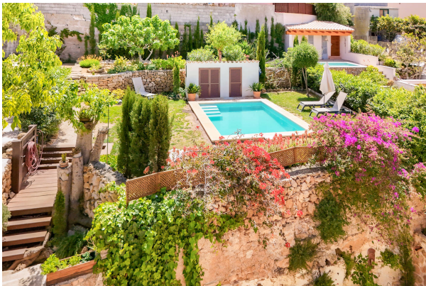
Einfach ein Paradies!