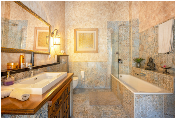
Badezimmer mit Duschwanne