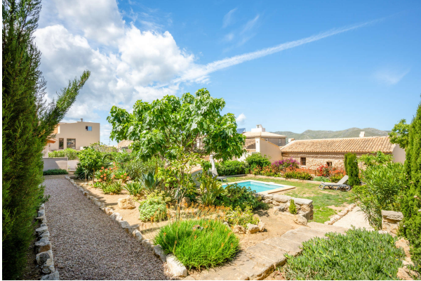
Kräuter- oder Gemüsegarten

Außergewöhnlich! Besonderes Schmuckstück mit Pool und mediterraner Oase. Obj. 7715