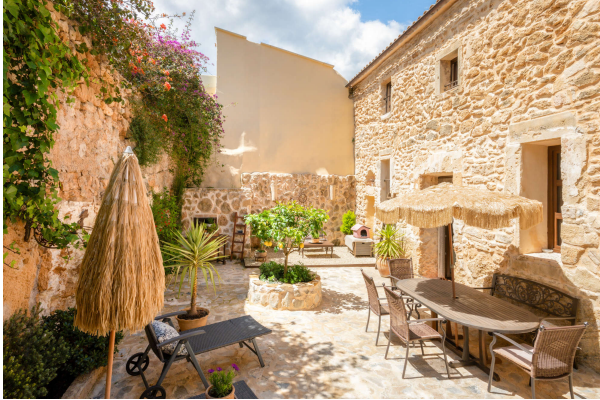
Gartentraum Ansicht 5

Außergewöhnlich! Besonderes Schmuckstück mit Pool und mediterraner Oase. Obj. 7715