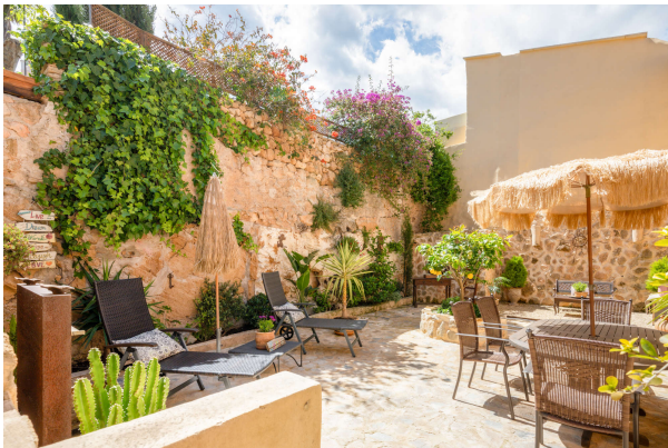
Gartentraum Ansicht 7