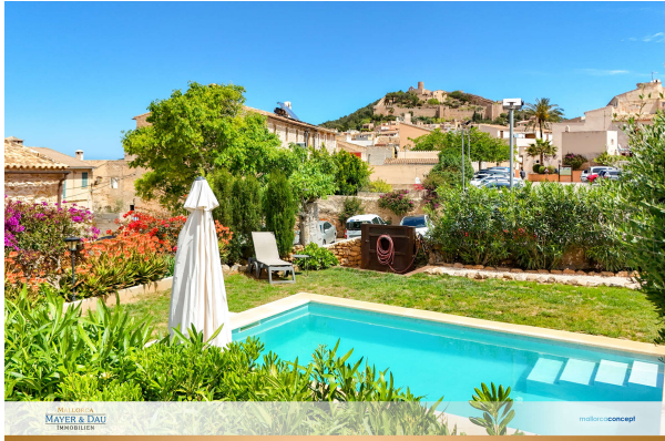
Garten mit spektakulärem Blick auf die Burg

Außergewöhnlich! Besonderes Schmuckstück mit Pool und mediterraner Oase. Obj. 7715