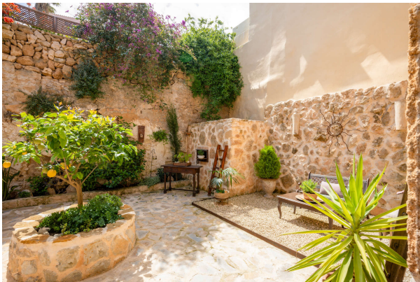
Gartentraum Ansicht 4