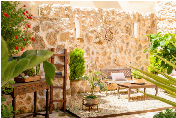
Gartentraum Ansicht 1