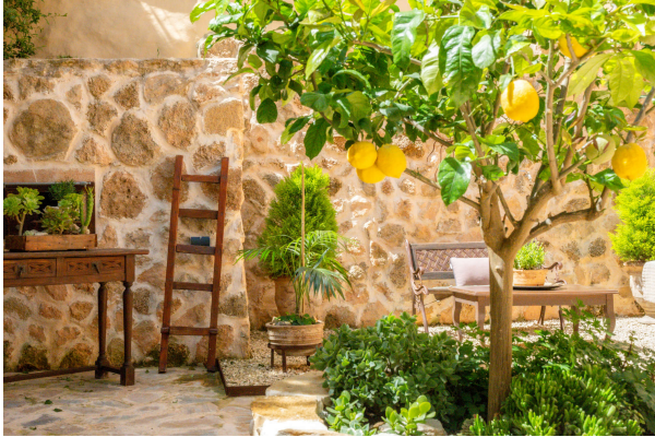
Gartentraum Ansicht 2

Außergewöhnlich! Besonderes Schmuckstück mit Pool und mediterraner Oase. Obj. 7715