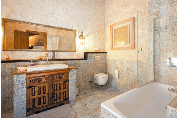
...mit hochwertigen Fliesen

Außergewöhnlich! Besonderes Schmuckstück mit Pool und mediterraner Oase. Obj. 7715