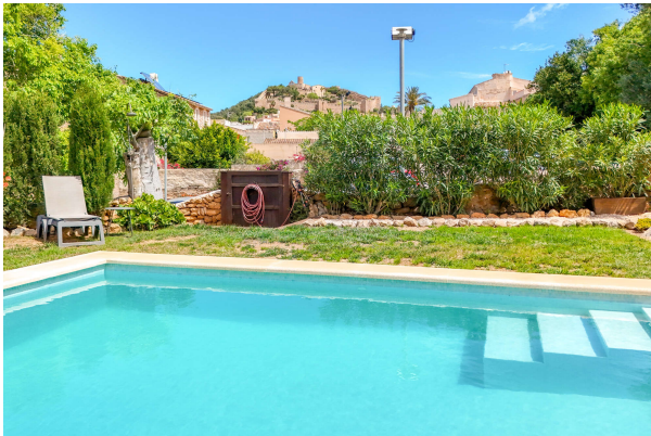
spektakulärer Blick zur Burg von Capdepera