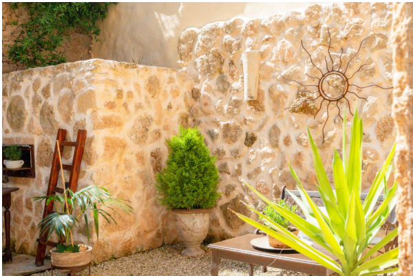
Gartentraum Ansicht 6