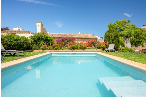
Pool Bereich 2

Außergewöhnlich! Besonderes Schmuckstück mit Pool und mediterraner Oase. Obj. 7715