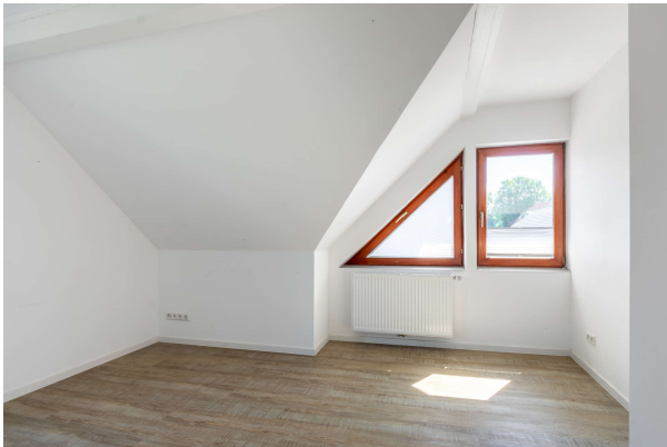
Büro Praxis OG