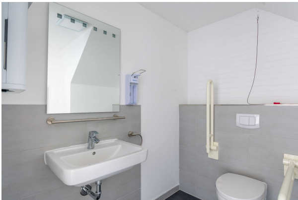
Behindertengerechtes WC Praxis