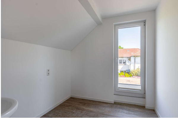
Wäscheraum Praxis OG

Bad Zwischenahn: Wohn- und Geschäftshaus mit vielfältigen Nutzungsmöglichkeiten, Obj. 7717