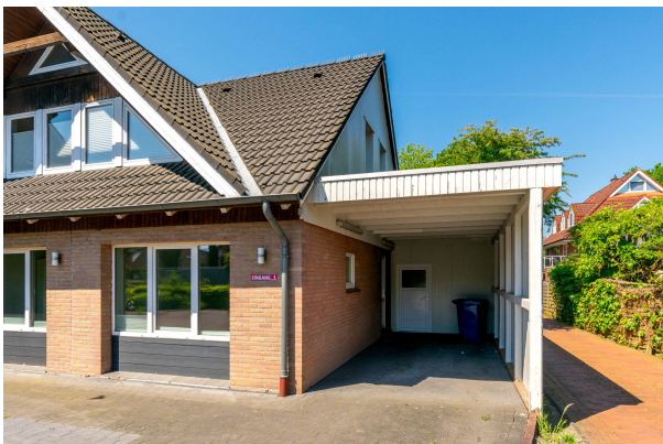
Carport und Eingang zur Praxis