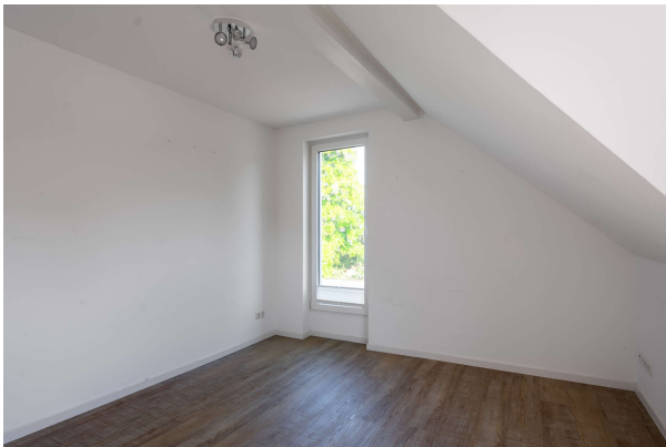
Büro Praxis OG