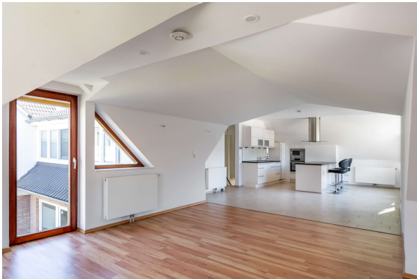
Wohnbereich mit Blick in die Küche OG