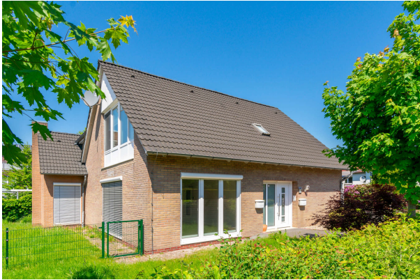
Blick auf den Eingang

Bad Zwischenahn: Wohn- und Geschäftshaus mit vielfältigen Nutzungsmöglichkeiten, Obj. 7717