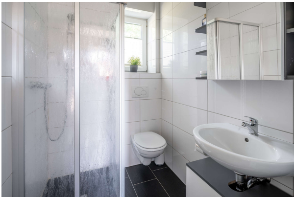
Bad 2 EG