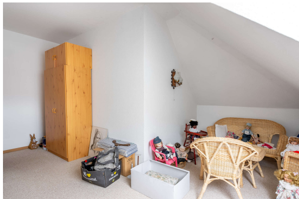
Zimmer 2 DG

Großefehn-Strackholt: Charmanter Bungalow in ruhiger Lage, auf großem Grundstück. Obj. 7773