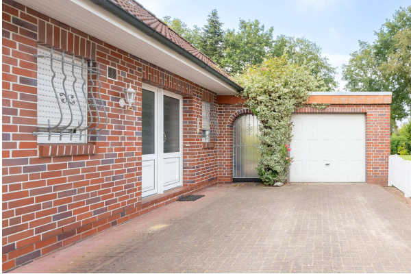
Blick auf den Hauseingang

Großefehn-Strackholt: Charmanter Bungalow in ruhiger Lage, auf großem Grundstück. Obj. 7773