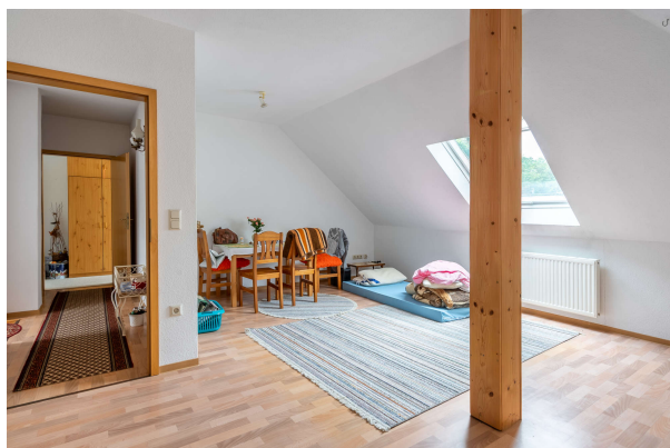
Zimmer 1 DG