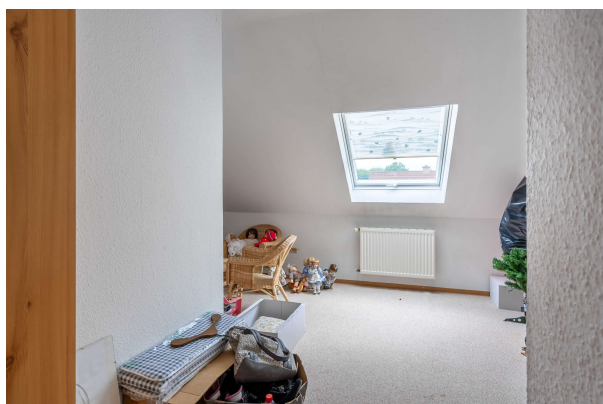
Zimmer 2 DG