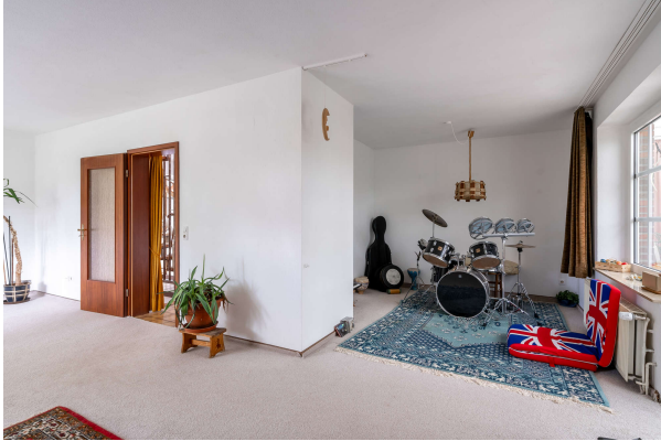
Wohnen und Essen

Bad Zwischenahn: Gemütliches Anwesen in ruhiger Lage mit viel Grün im Garten, Obj. 7783