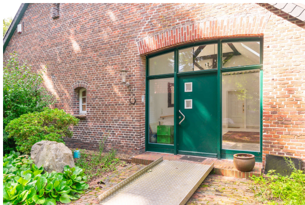
Blick auf den Eingang