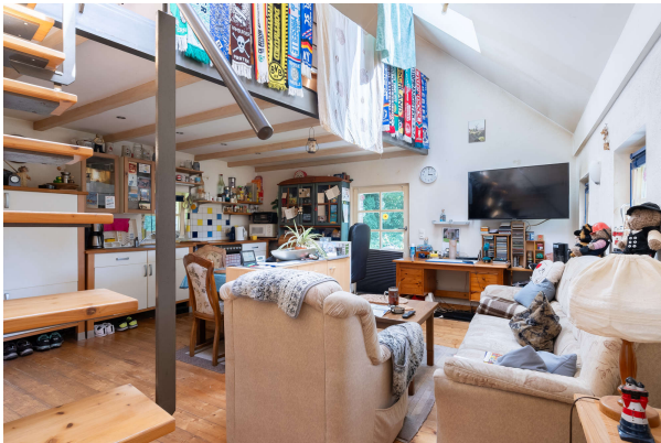
Wohn- und Essbereich Apartment 1