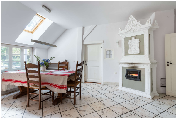
Esszimmer mit Grundofen