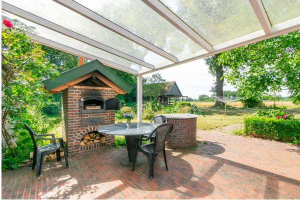
Terrasse mit Blick auf den Ofen

Bockhorn: Landhausanwesen mit Einliegerwhg. in ruhiger idyllischer Lage, Obj. 7870