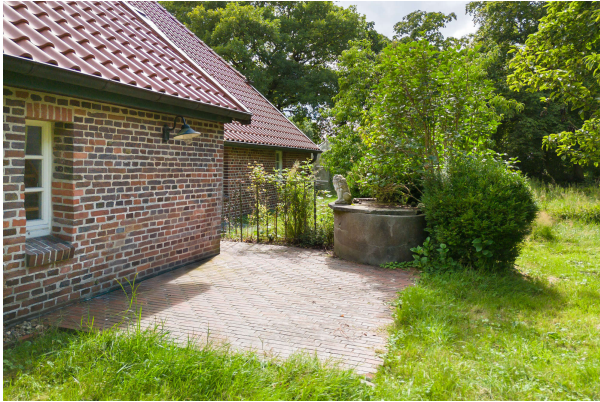
Terrasse Apartment 22

Bockhorn: Landhausanwesen mit Einliegerwhg. in ruhiger idyllischer Lage, Obj. 7870