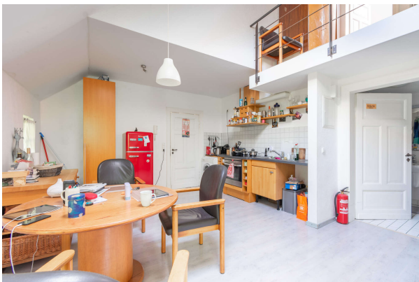
Küche Apartment 2