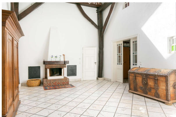
Diele mit Blick auf den Kamin