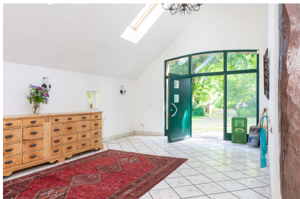
Diele mit Blick auf die Haustür

Bockhorn: Landhausanwesen mit Einliegerwhg. in ruhiger idyllischer Lage, Obj. 7870