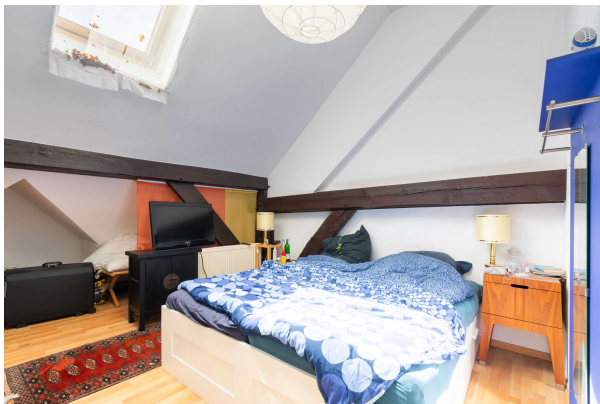
Schlafzimmer Apartment 2