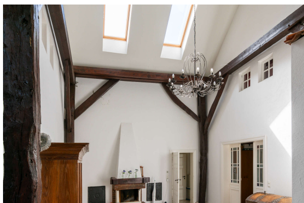
Diele mit Blick auf den Kamin