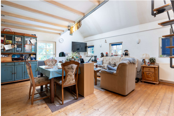
Wohn und Essbereich Apartment 1

Bockhorn: Landhausanwesen mit Einliegerwhg. in ruhiger idyllischer Lage, Obj. 7870