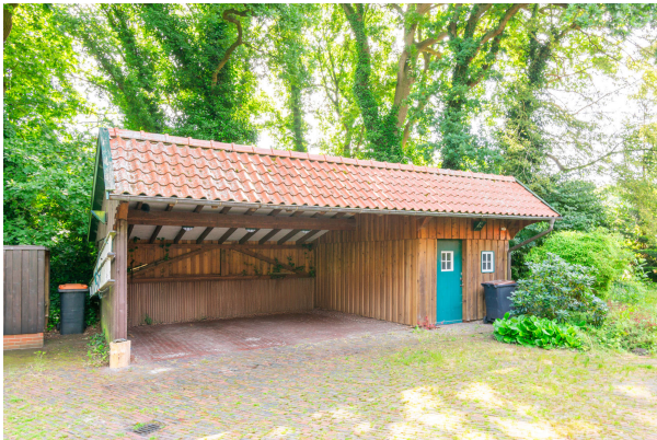
Carport mit Geräteraum