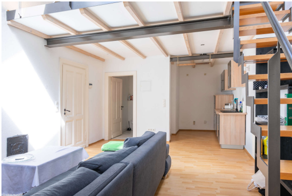
Wohnzimmer mit Blick auf die Küche