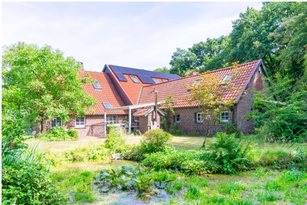
Rückansicht mit Blick auf die Terrasse