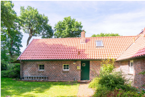
Eingang von Apartment 1