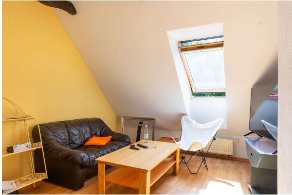
Wohnzimmer Apartment 2

Bockhorn: Landhausanwesen mit Einliegerwhg. in ruhiger idyllischer Lage, Obj. 7870