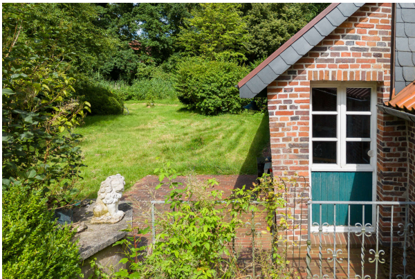
Blick auf den Eingang Apartment 2