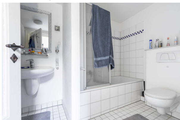
Badezimmer Apartment 2