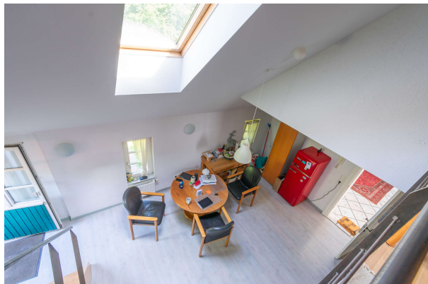
Blick von der Empore

Bockhorn: Landhausanwesen mit Einliegerwhg. in ruhiger idyllischer Lage, Obj. 7870