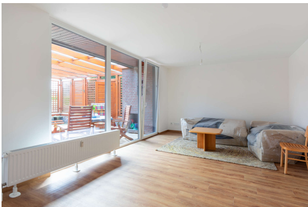
Wohnzimmer mit Zugang zur Terrasse