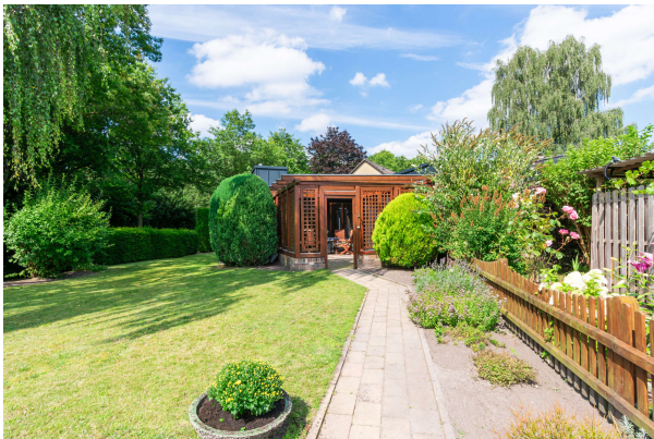
Zugang zum Haus