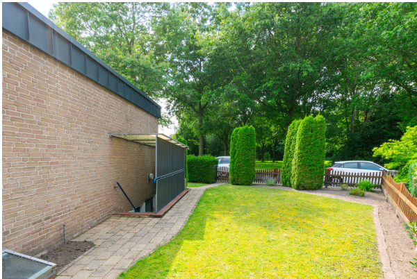
Zugang zum Keller