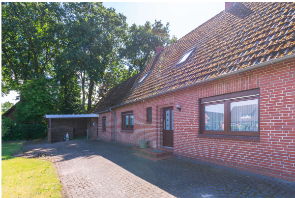
Blick auf den Hauseingang