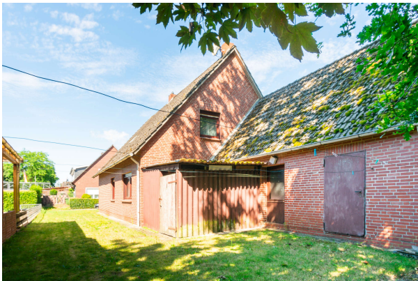
Garten mit Blick auf das Haus