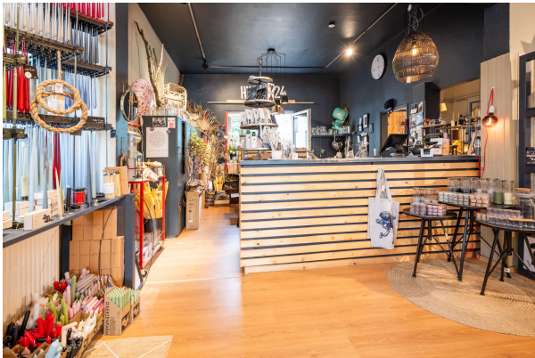
Ausstellungs- und Verkaufsfläche