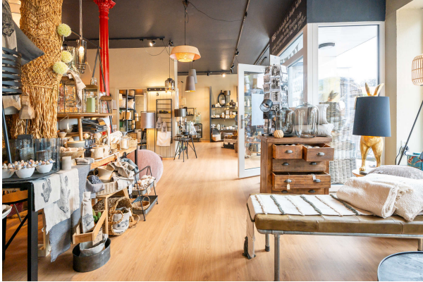
Ausstellungs- und Verkaufsfläche

Westerstede: Repräsentatives Wohn- und Geschäftshaus in Zentrumslage, Obj. 7911