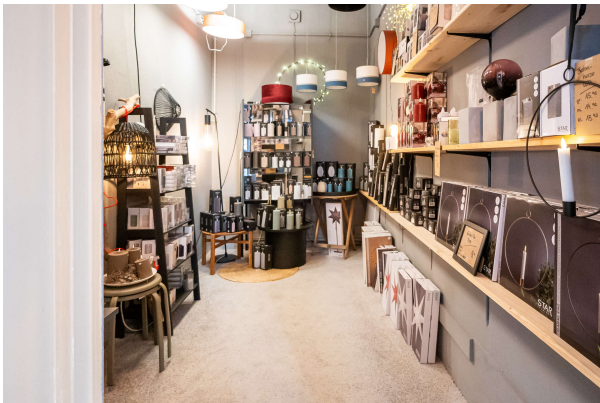
Ausstellungs- und Verkaufsfläche