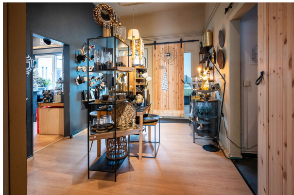
Ausstellungs- und Verkaufsfläche

Westerstede: Repräsentatives Wohn- und Geschäftshaus in Zentrumslage, Obj. 7911