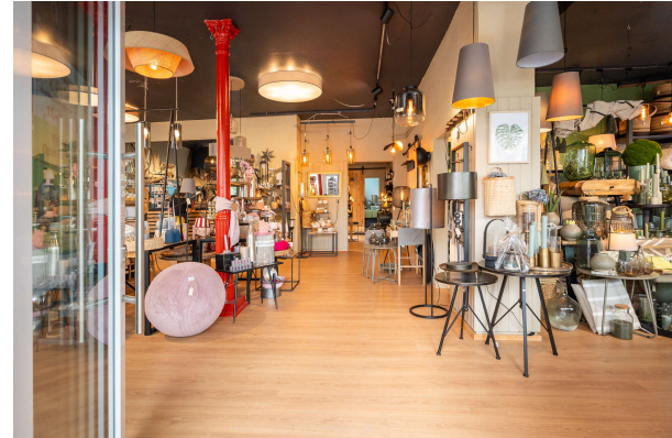
Ausstellungs- und Verkaufsfläche