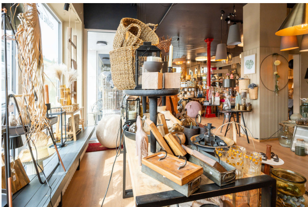
Ausstellungs- und Verkaufsfläche