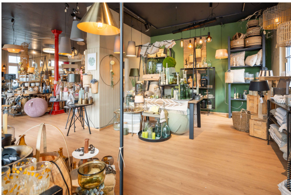
Ausstellungs- und Verkaufsfläche