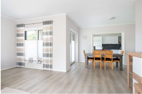
Blick zum Essbereich

Saterland-Strücklingen: ebenerdiges wohnen im modernen Bungalow aus dem BJ. 2022, Objekt: 7932