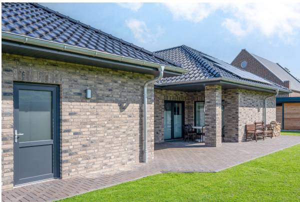
Blick auf die Terrasse