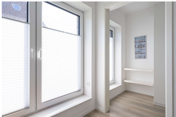
Blick in das Ankleidezimmer

Saterland-Strücklingen: ebenerdiges wohnen im modernen Bungalow aus dem BJ. 2022, Objekt: 7932