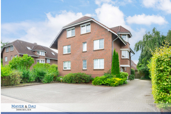
MAYER & DAU IMMOBILIEN

Bad Zwischenahn: Attraktive Eigentumswohnung in ruhiger und zentraler Lage, Obj. 7965