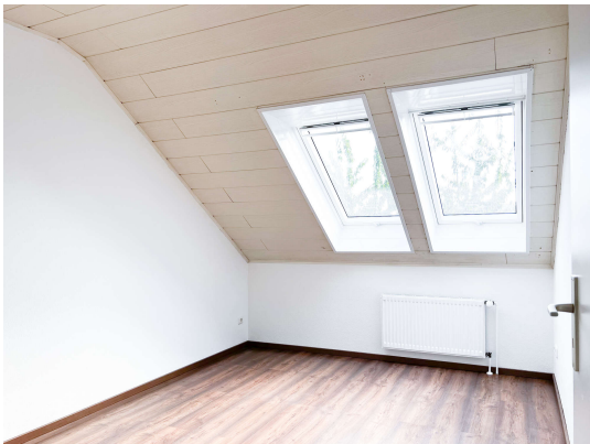
Zimmer 3 Obergeschoss