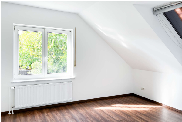
Zimmer 2 Obergeschoss