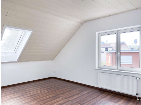
Zimmer 1 Obergeschoss

Frisch sanierte DHH in ruhiger Lage, nur 25 Min. vom pulsierenden Kurfürstendamm entfernt! Obj 8036