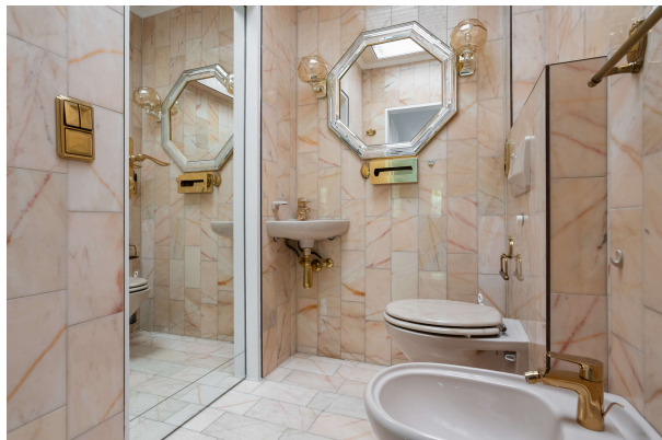
WC mit Zugang zu allen Schlafzimmern

Repräsentativer und vielseitiger Bungalow mit großer Gewerbeeinheit in südlicher Randlage Münchens