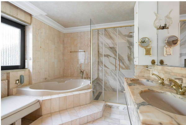
Bad mit Eckbadewanne und Dusche