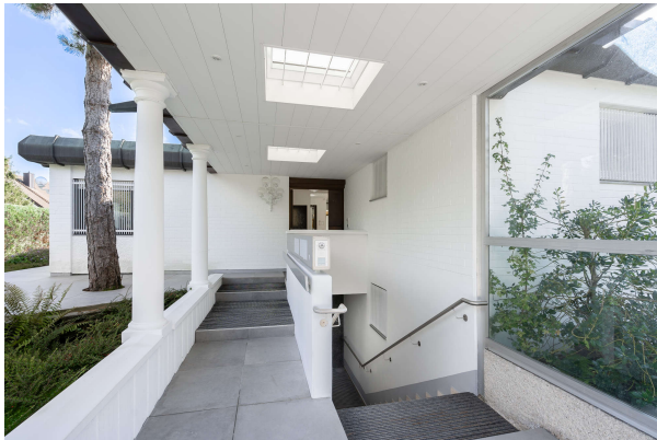
Eingänge Erdgeschoss und Souterrain