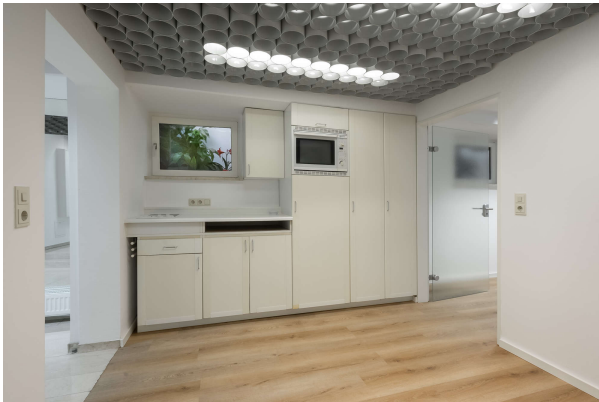
Küche mit Aufenthaltsraum