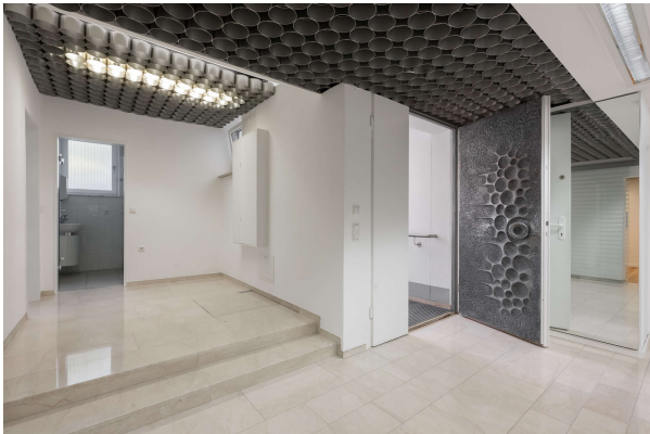
Flur mit Empfangsbereich