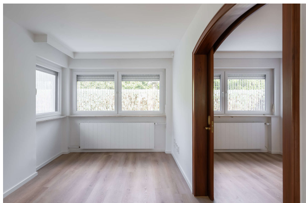
zwei Kinderzimmer mit Trennelement