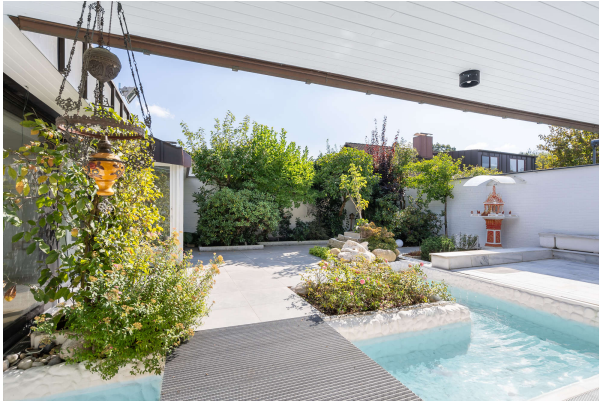
Atriumgarten mit Wasserbecken

Repräsentativer und vielseitiger Bungalow mit großer Gewerbeeinheit in südlicher Randlage Münchens