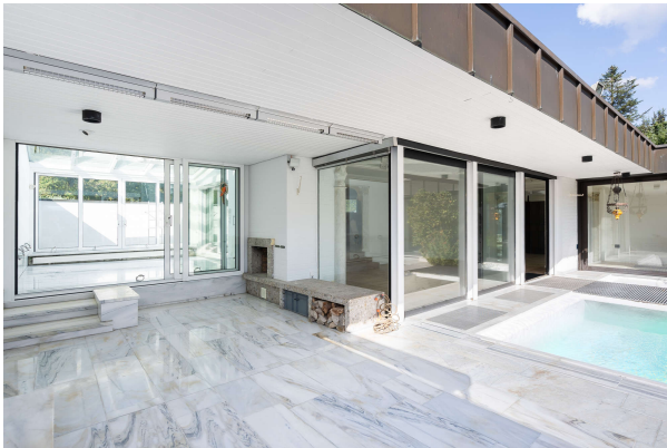
überdachte Terrasse mit Außenkamin