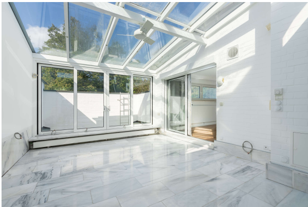
Wintergarten mit Pflanzenbewässerung