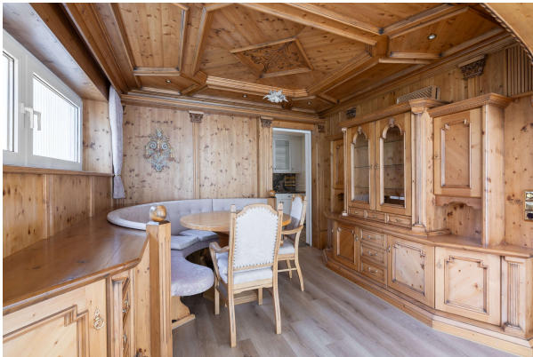
Essbereich aus Holzelementen