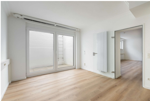
Büro mit Terrasse