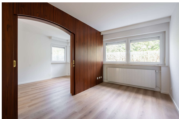
zwei Kinderzimmer mit Trennelement