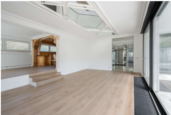
Wohn- und Essbereich auf zwei Ebenen