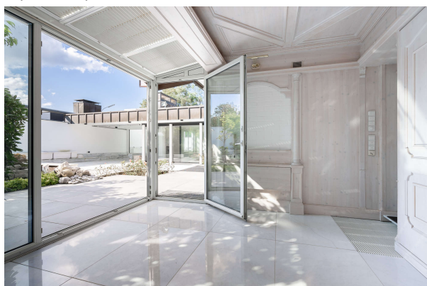
Apartment mit Holzelementen