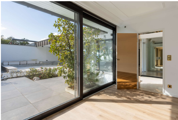
Blick in den Garten