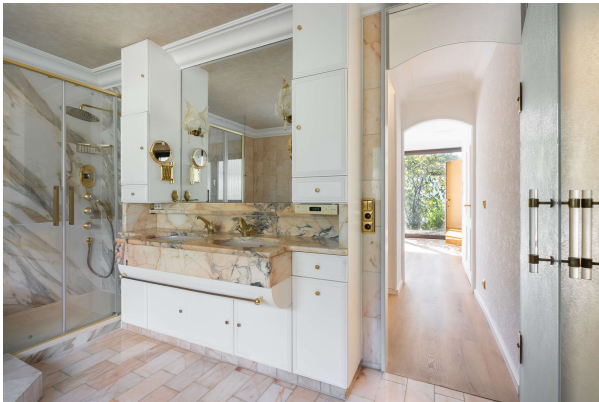
hochwertiges Bad en Suite