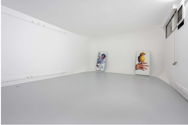
vielseitig nutzbarer Raum mit 70 m 2 und 3,5 m Deckenhöhe