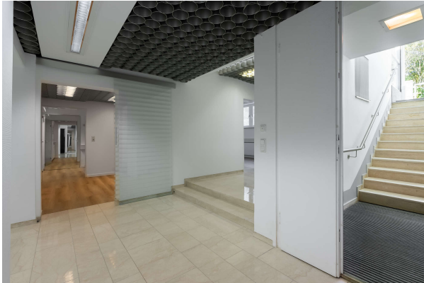
Flur mit Empfangsbereich

Repräsentativer und vielseitiger Bungalow mit großer Gewerbeeinheit in südlicher Randlage Münchens