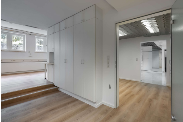
Büro mit Einbauschränken