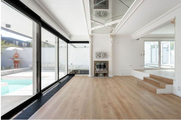
großzügiges und lichtdurchflutetes Wohnzimmer

Repräsentativer und vielseitiger Bungalow mit großer Gewerbeeinheit in südlicher Randlage Münchens