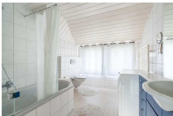
Tageslichtbad - OG