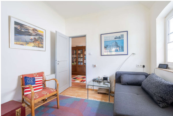
Büro - EG