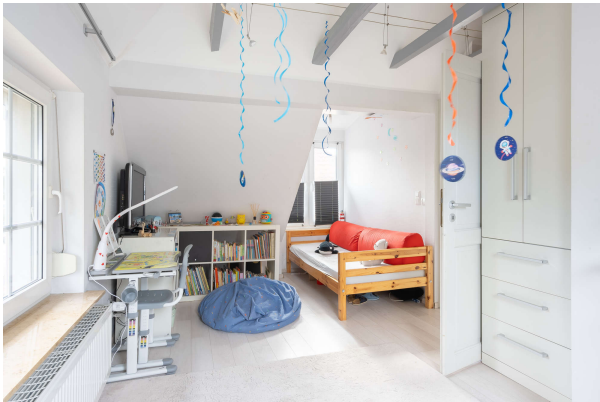
Schlafzimmer - OG