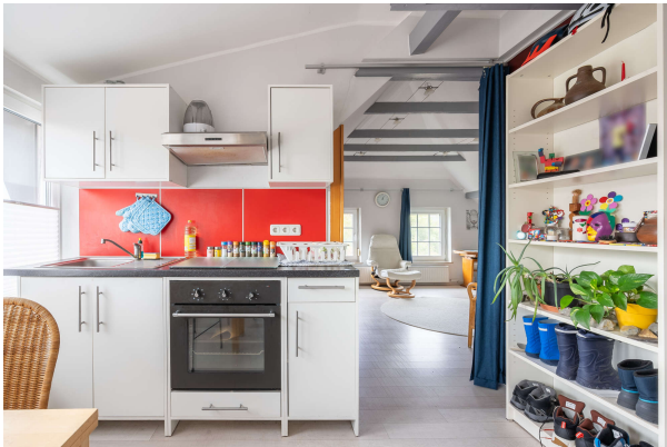
offene Küche - OG