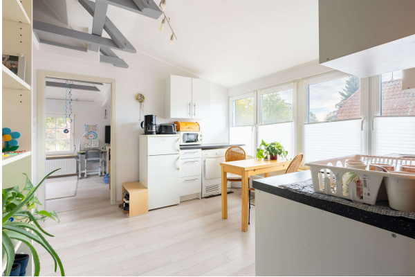
offene Küche - OG

Traumhaftes Ein- bzw. Zweifamilienhaus mit schönem Garten und Garage in Dietrichsfeld, Obj. 8068