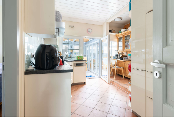
Blick in die Küche - EG

Traumhaftes Ein- bzw. Zweifamilienhaus mit schönem Garten und Garage in Dietrichsfeld, Obj. 8068