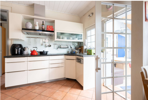
Küche - EG