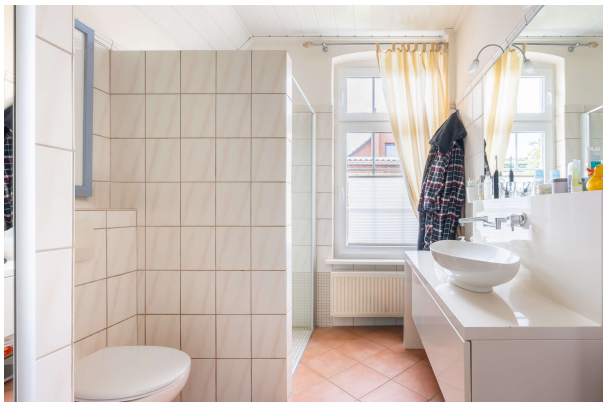
Tageslichtbad - EG

Traumhaftes Ein- bzw. Zweifamilienhaus mit schönem Garten und Garage in Dietrichsfeld, Obj. 8068