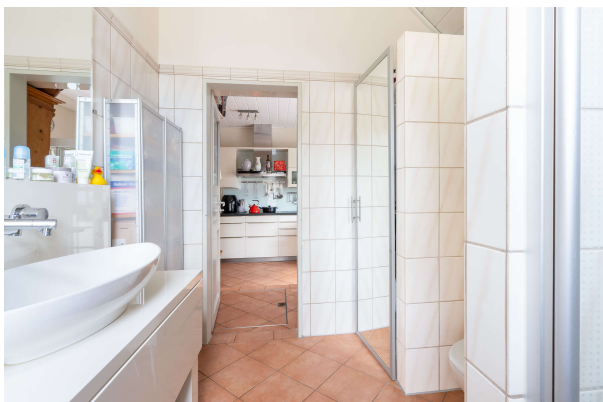
Tageslichtbad - EG