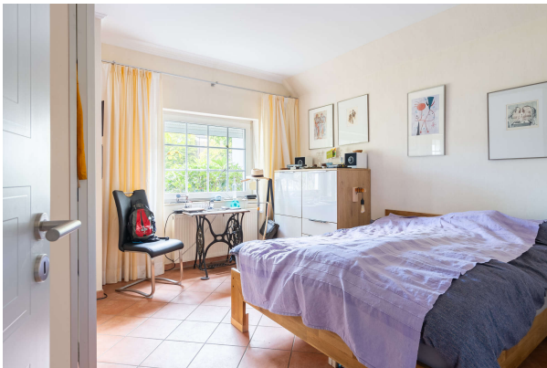
Schlafzimmer - EG