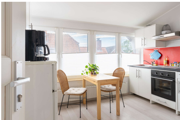
offene Küche - OG