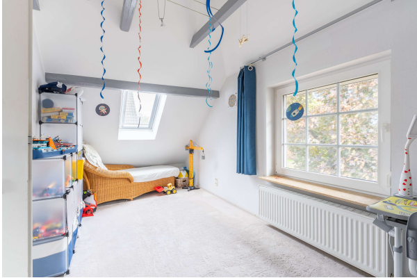
Schlafzimmer - OG

Traumhaftes Ein- bzw. Zweifamilienhaus mit schönem Garten und Garage in Dietrichsfeld, Obj. 8068