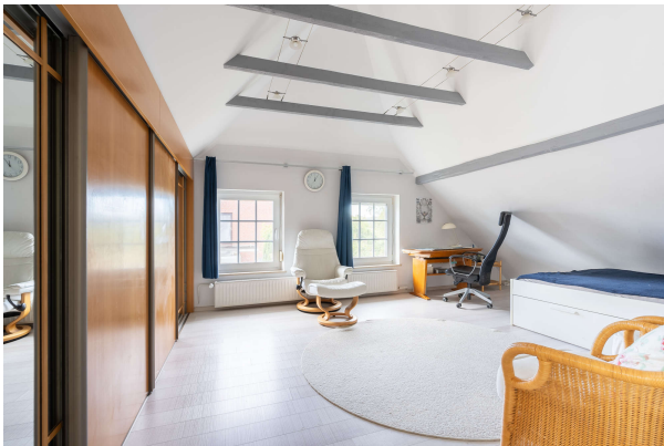
Wohnbereich - OG