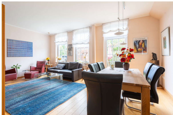
Wohn-/ Essbereich - EG

Traumhaftes Ein- bzw. Zweifamilienhaus mit schönem Garten und Garage in Dietrichsfeld, Obj. 8068