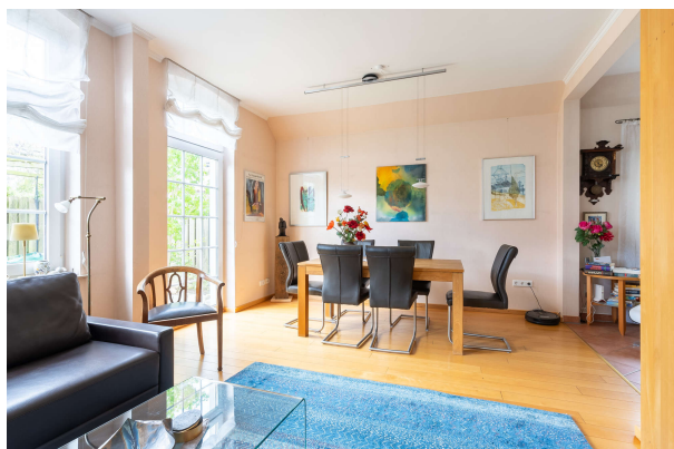
Wohn-/ Essbereich - EG