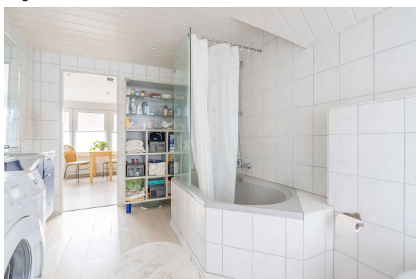
Tageslichtbad - OG