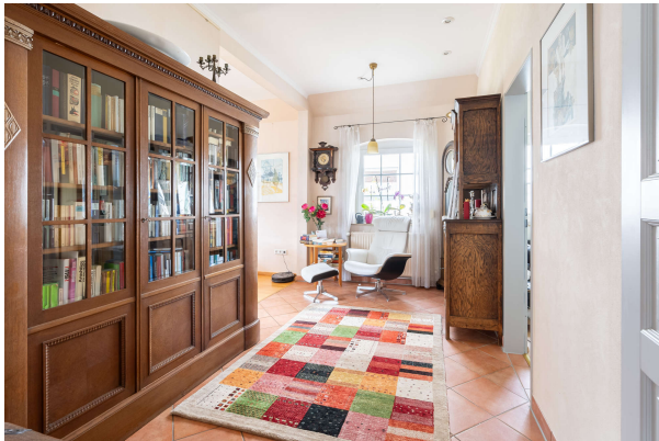
Wohn-/ Essbereich - EG