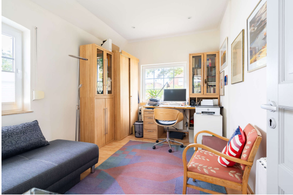
Büro - EG

Traumhaftes Ein- bzw. Zweifamilienhaus mit schönem Garten und Garage in Dietrichsfeld, Obj. 8068