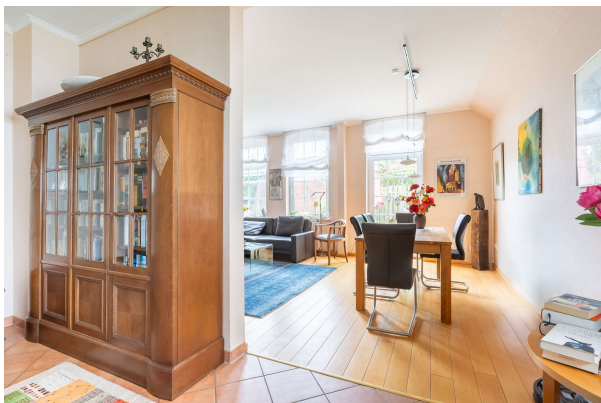
Wohn-/ Essbereich - EG