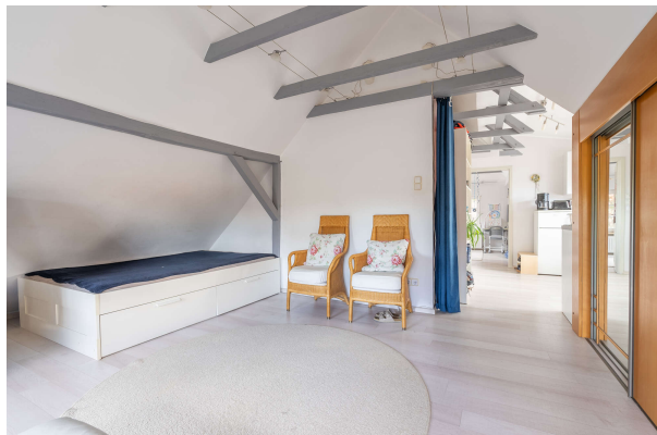
Wohnbereich - OG

Traumhaftes Ein- bzw. Zweifamilienhaus mit schönem Garten und Garage in Dietrichsfeld, Obj. 8068