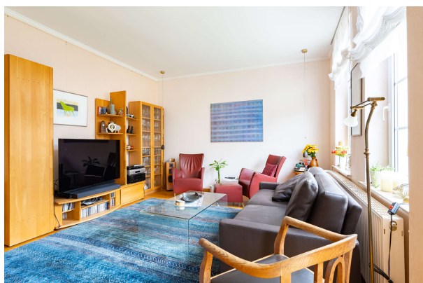
Wohn-/ Essbereich - EG