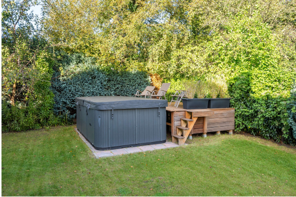
Pool mit Gegenstromanlage

Traumhaftes Ein- bzw. Zweifamilienhaus mit Garage in beliebter Lage von Rastede, Obj. 8075