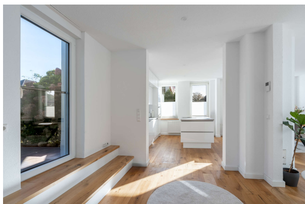
Blick in den Wohn-/Essbereich