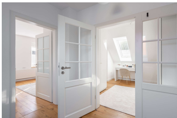
Blick in das Schlafzimmer und Ankleidezimmer