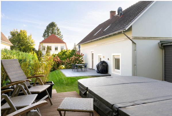
Blick in den Garten