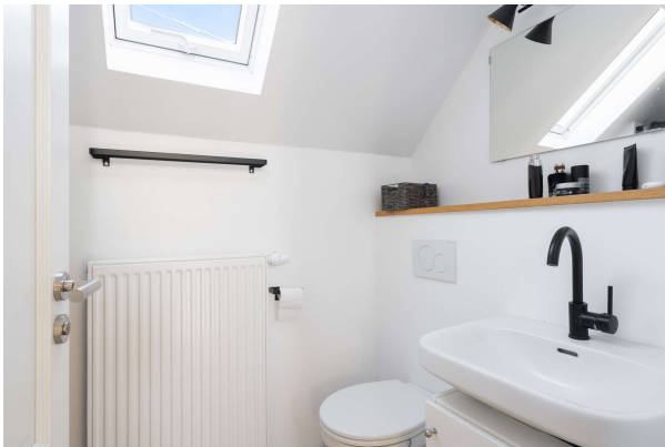
Tageslichtbad - OG