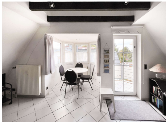
Wohn - Essbereich

Cuxhaven / Duhnen: Maisonette Ferienwohnung in unmittelbarer Strandnähe, Obj. 8153