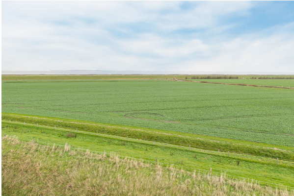
Blick auf die Nordsee

Dornum: Bungalow direkt am Deich in ruhiger Lage, Obj. 8172