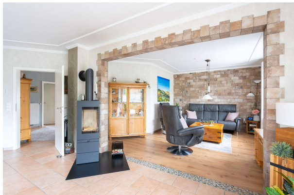
Wohnbereich mit Blick auf den Kamin

Dornum: Bungalow direkt am Deich in ruhiger Lage, Obj. 8172