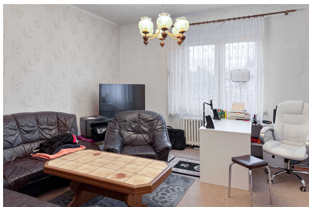
Zimmer 1 OG