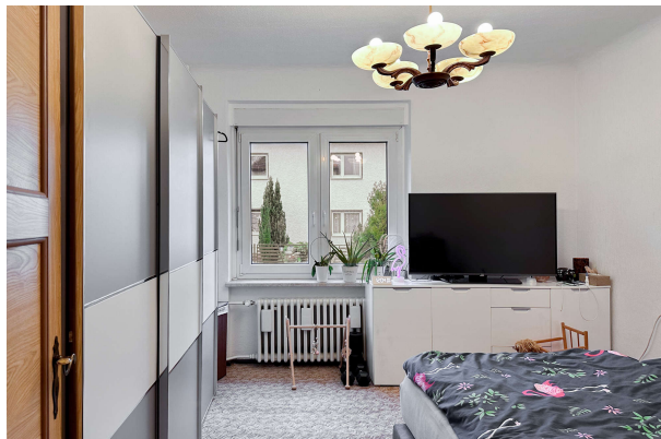
Zimmer 2 EG

Ihre neues Heim auf sonnigem Grundstück mit viel Potential, im begehrten Märchenviertel! Obj 8251