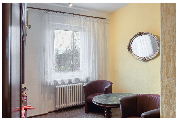
Zimmer 3 OG