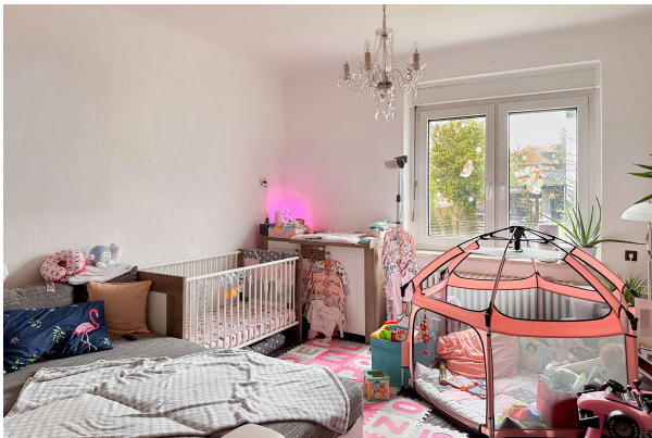
Zimmer 1 EG