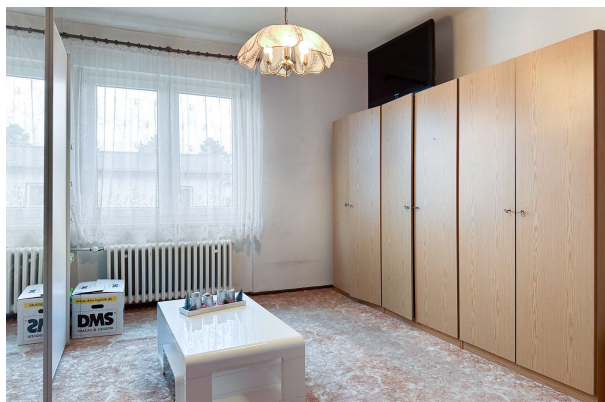
Zimmer 2 OG

Ihre neues Heim auf sonnigem Grundstück mit viel Potential, im begehrten Märchenviertel! Obj 8251