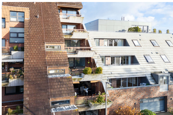
Blick auf den Balkon

Bad Zwischenahn: 2,5-Zimmer-Eigentumswohnung am Yachthafen, Obj. 8257