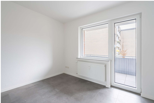
Vielseitig nutzbares Zimmer