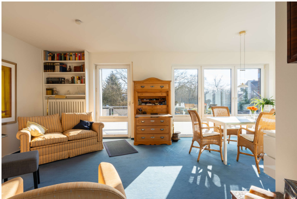
Blick vom Wohnbereich zum Essbereich