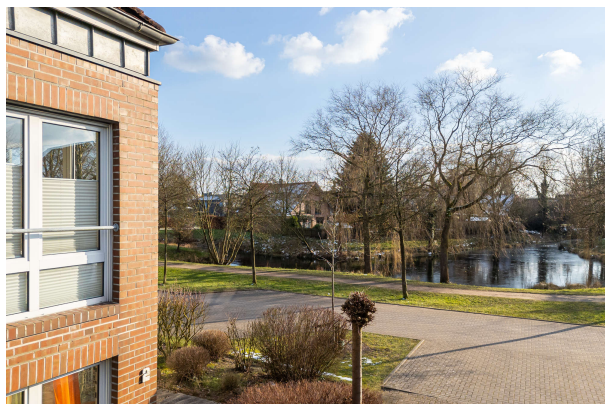
Blick in Südrichtung

Oldenburg-Bloherfelde: Kapitalanleger aufgepasst! Attraktive 2,5-Zimmer-Eigentumswohnung. Obj. 8330