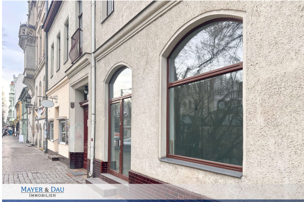
MAYER & DAU IMMOBILIEN Titelbild

Attraktives Ladengeschäft mit eindrucksvollen Schaufenstern in Bestlage von Berlin Friedrichshagen!