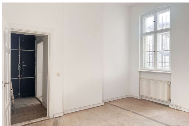
2. Eingang seitlich