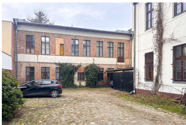
Hofseite mit Garage