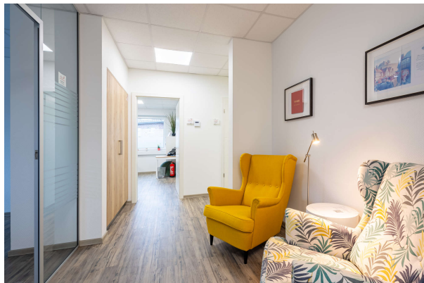
Flur mit Wartebereich

Moderne und gut angebundene Bürofläche im attraktiven Gewerbegebiet! Obj. 8399