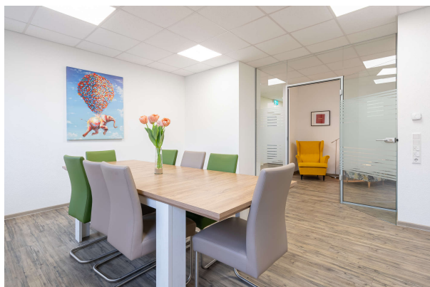
Besprechungsraum mit Glaselement