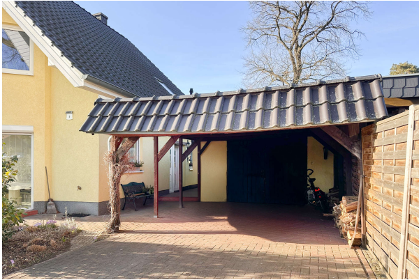
Garage und Carport

Gepflegter Wohnraum in Hinterlage, auf sonnigem Grundstück in ruhiger Umgebung! Obj. 8540